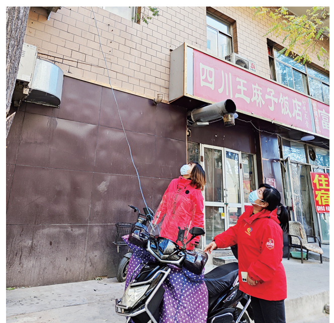
11月18日,幸福社区工作人员和民警深入辖区居民院落,开展安全隐患排查和消防宣传活动。活动主要针对租户较多、老年人较多的单元楼,重点关注用电用气安全、占用消防通道等情况。针对排查中发现问题,工作人员及时记录并督促整改,做到防患于未然。