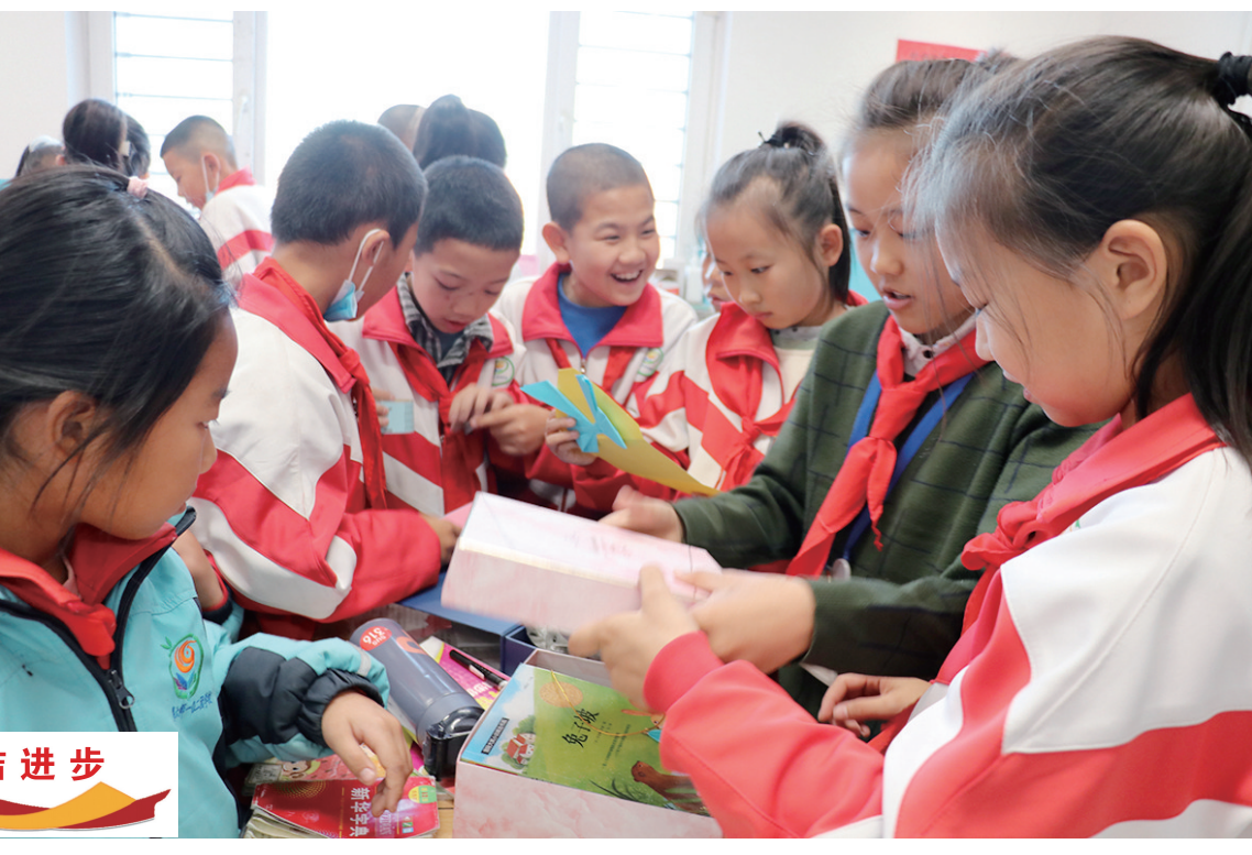
千里之外的礼物。新疆生产建设兵团第六师一〇二团学校的学生收到来自晋源区实验小学的礼物。