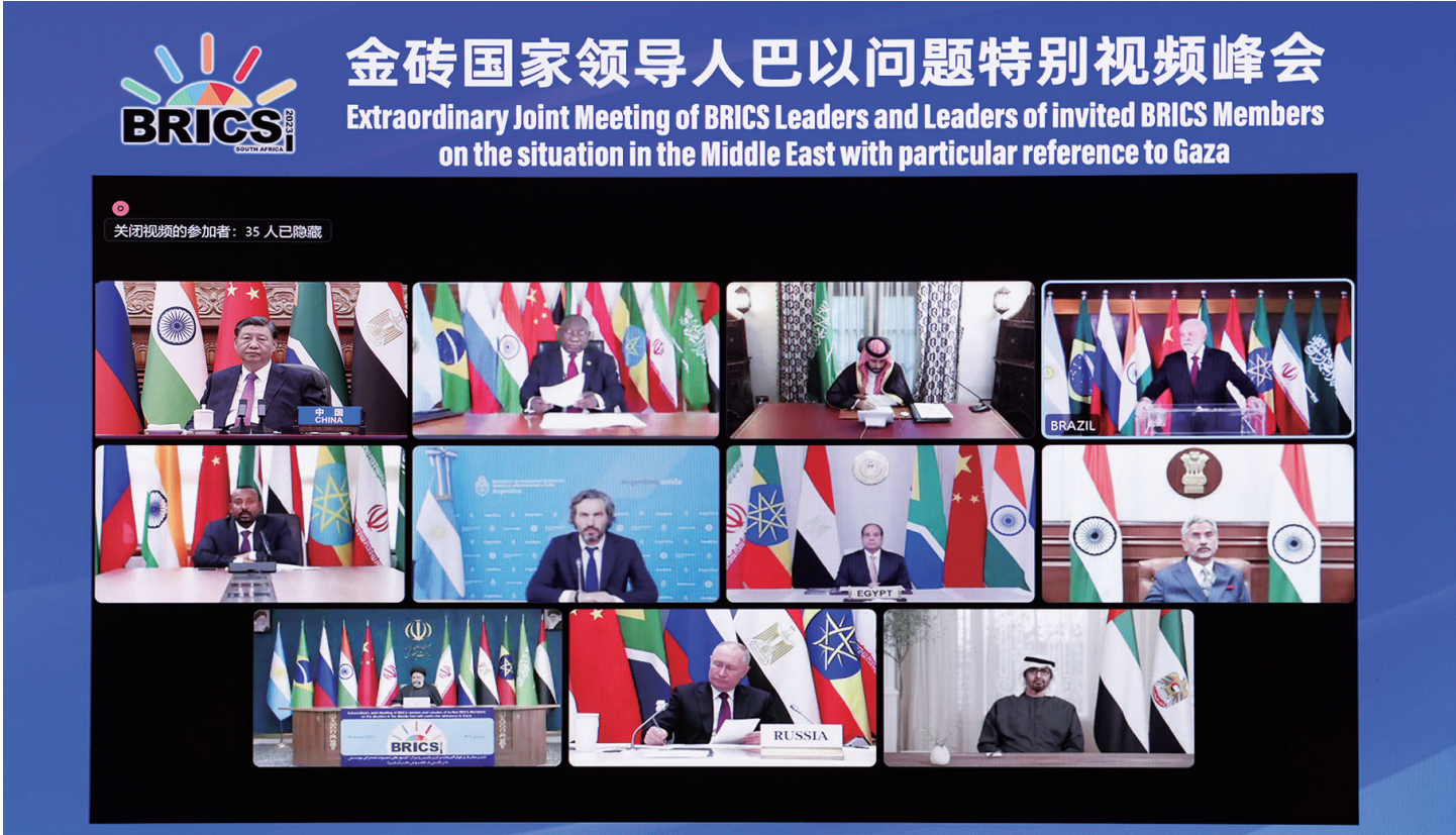
11月21日晚,国家主席习近平出席金砖国家领导人巴以问题特别视频峰会并发表题为《推动停火止战 实现持久和平安全》的重要讲话。

新华社北京11月21日电 11月21日晚,国家主席习近平出席金砖国家领导人巴以问题特别视频峰会并发表题为《推动停火止战 实现持久和平安全》的重要讲话。 习近平指出,本次峰会是金砖扩员后的首场领导人会晤。当前形势下,金砖国家就巴以问题发出正义之声、和平之声,非常及时、非常必要。加沙地区的冲突已持续一个多月,造成大量平民伤亡和人道主义灾难,并出现扩大外溢趋势,中方深表关切。当务之急,一是冲突各方要立即停火止战,停止一切针对平民的暴力和袭击,释放被扣押平民,避免更为严重的生灵涂炭。二是要保障人道主义救援通道安全畅通,向加沙民众提供更多人道主义援助,