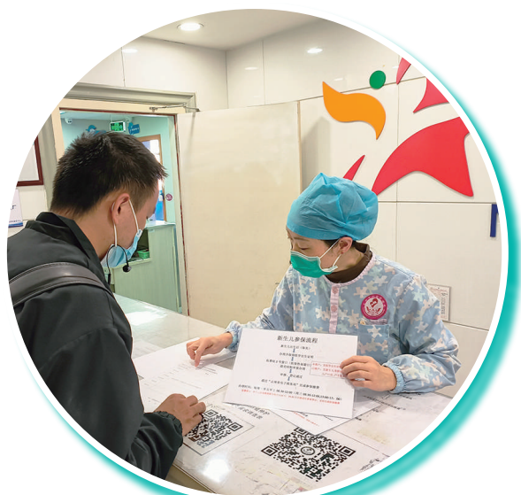
11月22日,昆明市妇幼保健院的工作人员向市民介绍新生儿参保流程。

作为云南省分娩量较大的医院,昆明市妇幼保健院于9月1日正式开通新生儿医保经办服务点,成为昆明市首个专门为新生儿参保开通的医院端医保服务经办点。