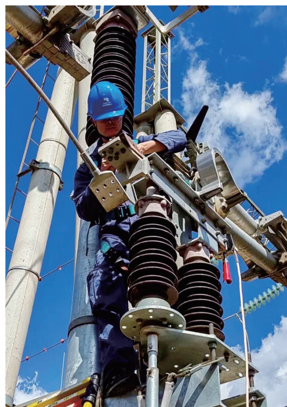
11月10日,南方电网云南曲靖供电局变电检修所工作人员在110千伏太平明变电站进行融冰电缆搭接及升流试验工作。

国家发展改革委最新发布的数据显示,目前全国煤炭生产供应平稳有序,运输得到有力保障,全国统调电厂存