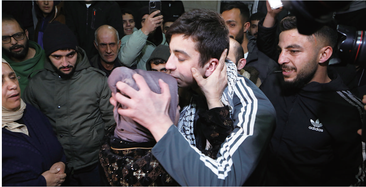
11月27日,在约旦河西岸城市希伯伦北部的一座村庄,一名获释的巴勒斯坦人与亲人团聚。

卡塔尔外交部11月27日发表声明说,巴勒斯坦伊斯兰抵抗运动(哈马斯)与以色列已同意将加沙地带人道主义停火期限延长两天。哈马斯同日发表声明说,哈马斯同埃及和卡塔尔达成协议,将加沙地带停火期限延长两天。