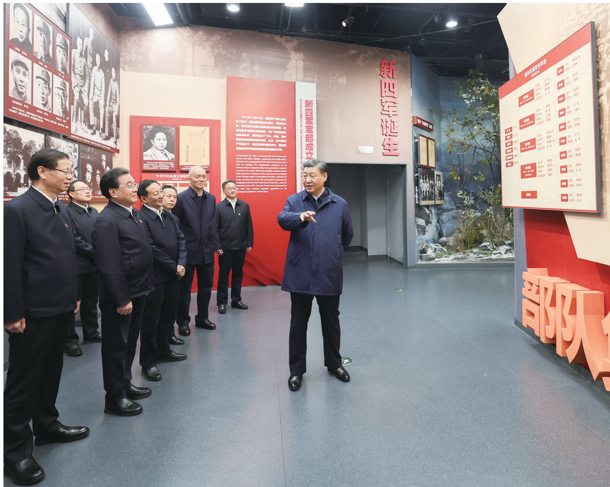
12月3日,中共中央总书记、国家主席、中央军委主席习近平在上海考察结束返京途中,来到江苏省盐城市参观新四军纪念馆。

新华社上海/江苏盐城12月3日电 中共中央总书记、国家主席、中央军委主席习近平近日在上海考察时强调,上海要完整、准确、全面贯彻新发展理念,围绕推动高质量发展、构建新发展格局,聚焦建设国际经济中心、金融中心、贸易中心、航运中心、科技创新中心的重要使命,以科技创新为引领,以改革开放为动力,以国家重大战略为牵引,以城市治理现代化为保障,勇于开拓、积极作为,加快建成具有