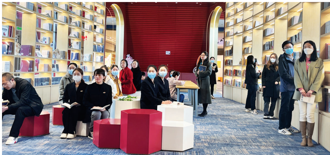
阅读区开展“市博读书日”活动。