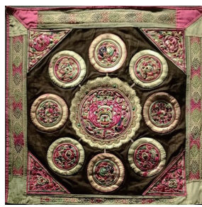
侗族“八菜一汤”刺绣背带