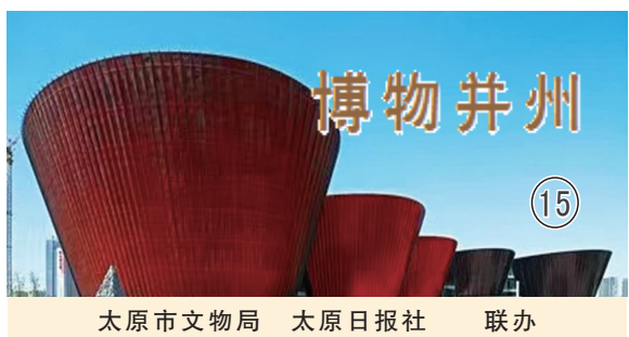
太原市文物局 太原日报社 联办