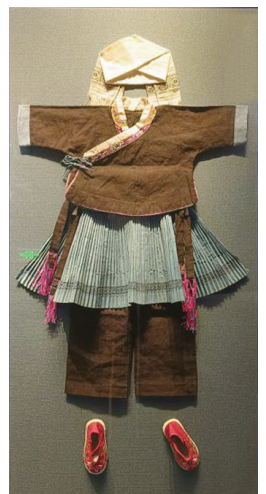
隆林壮族“三层楼”女童服