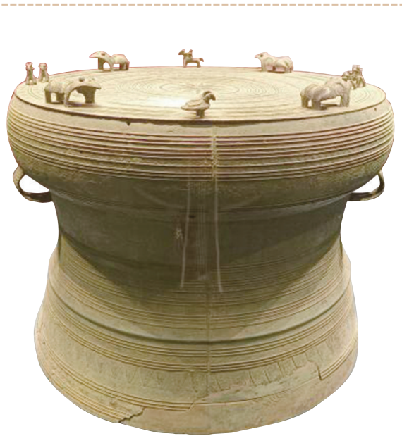
乘骑水鸟饰变形羽人纹铜鼓

汉代腌菜的双领罐在其他各地墓葬中亦有出土，如湖南衡阳东吴墓、江西瑞昌西晋墓、广西恭城南朝墓、湖北武汉测绘学院隋墓、贵州平坝唐墓等，但此类双领罐与其他常见的出土罐型相比，并不多见。