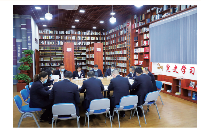
职工们在书屋内学习。郑彦说，社会在不断发展进步，企业不能掉队，关键在于企业中的个体不能掉队。企业将继续多配书、配好书，希望职工读好书、用好书，使职工书屋成为开启职工智慧、激发职工活力、丰富职工生活的精神园地。

（上接第1版）三、积极支持地方建设，深入开展爱民助民活动 驻驻各部队要充分发挥自身优势，弘扬光荣传统，践行服务宗旨，着眼地方所需、群众所盼、部队所能，大力支持太原经济社会建设。