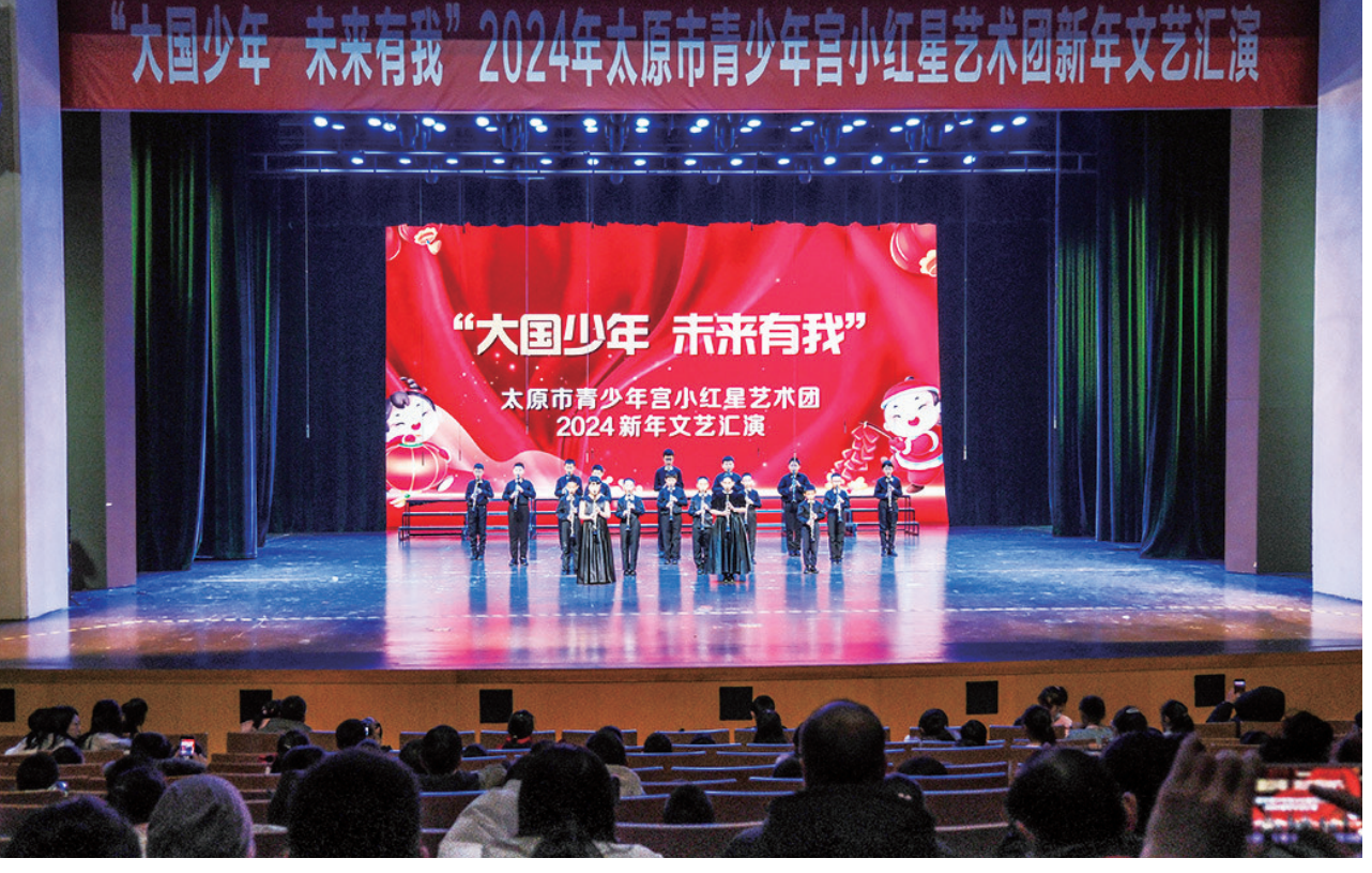
12月24日，太原市青少年宫小红星艺术团在工人文化宫举办“大国少年 未来有我”2024新年文艺汇演。小演员们通过器乐、武术、合唱等节目，展示了少年儿童的艺术才华和风采。

本报讯 12月24日，市卫健委发布消息，在刚刚结束的2023年山西省现场流行病学调查职业技能竞赛中，我市代表队取得优异成绩。经过激烈角逐，在全省12支参赛代表队中，太原市卫健委荣获团体二等奖；在全省60名参赛选手中，我市5名选手全部获奖，其中，个人二等奖2人、个人三等奖2人、个人优秀奖1人。