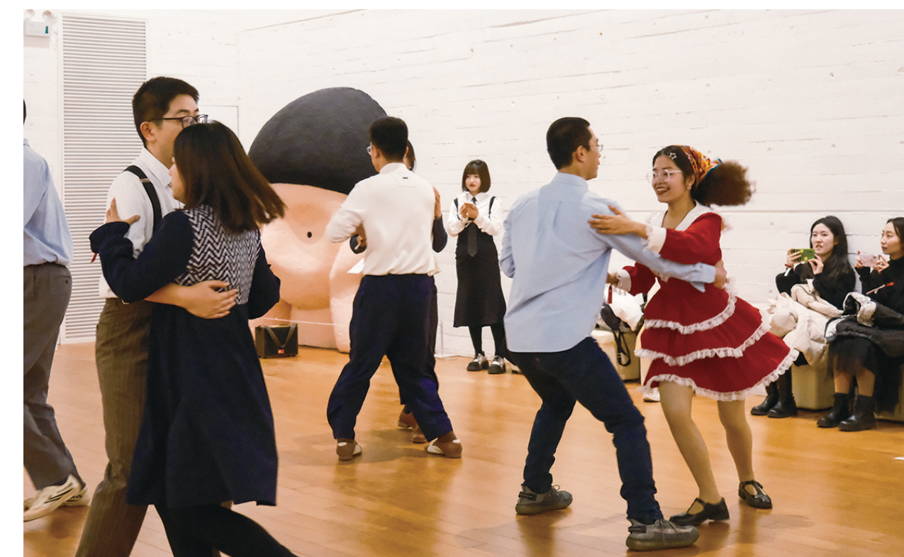
1月1日,市民在长江美术馆以摇摆舞会的形式庆贺新年。