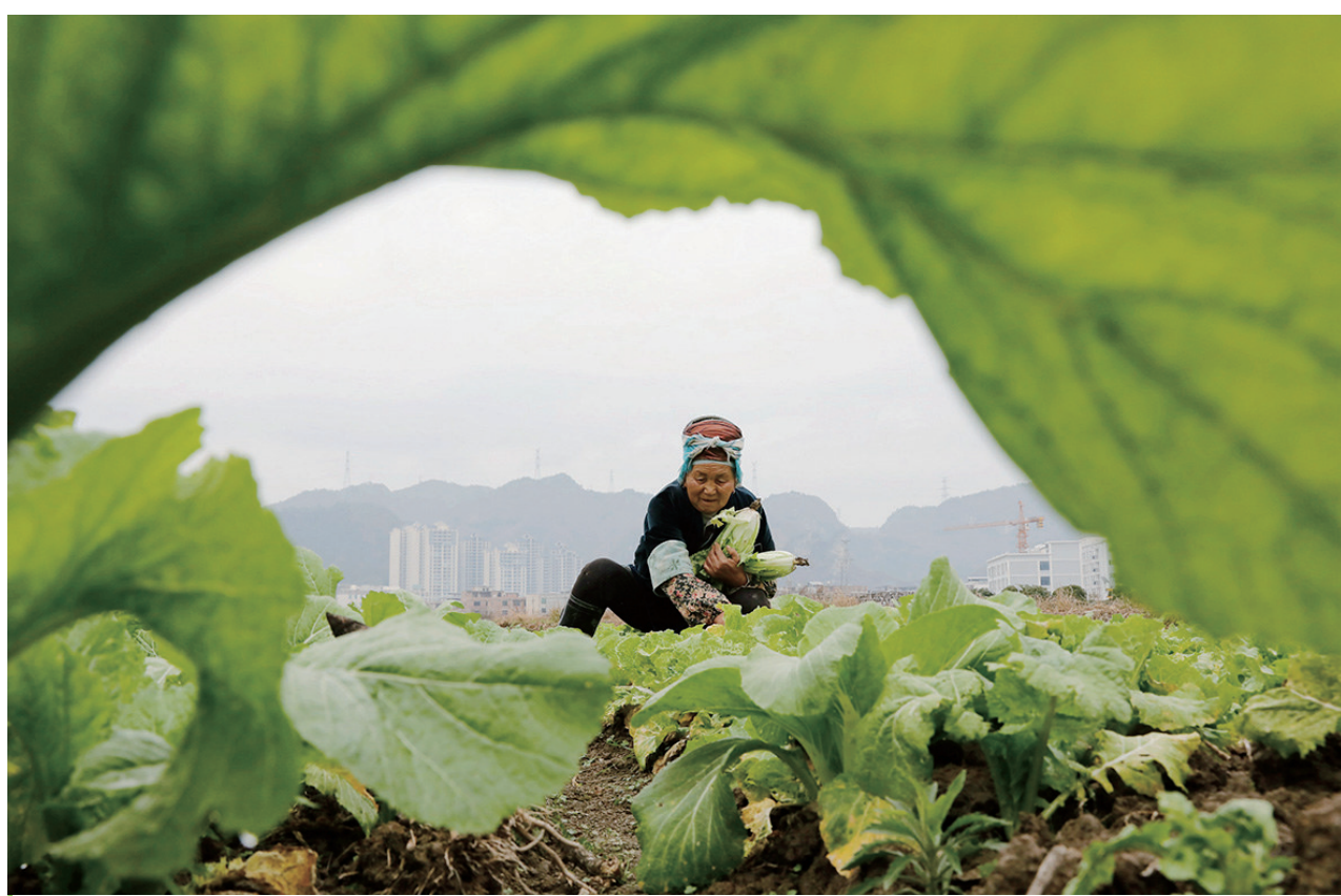
1月4日，贵州省黔东南苗族侗族自治州施秉县城关镇平宁社区的农民在收获蔬菜。小寒节气临近，农民有序开展冬季农业生产。

“中国网事·感动2023”十大年度网络人物有：“义务理发师”贾湖江、“80多个孩子的妈妈”朱培娟、“三次被村民联名请愿留任的第一书记”莫日发、“螺丝钉志愿者”朱言春、“侠骨柔情的反诈民警”涂凯峰、暴雨中的硬汉“铁路蓝”赵阳、“用短视频助力乡村振兴”的莫宙、“坚守三尺讲台39载的山村教师”杨红军、“孝老爱亲模范”汪萍、传承红色基因的“故事爷爷”王忠祥。