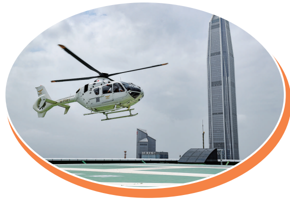
东部通航的直升机准备降落在深圳市中心的大中华直升机场(2021年3月18日报)。