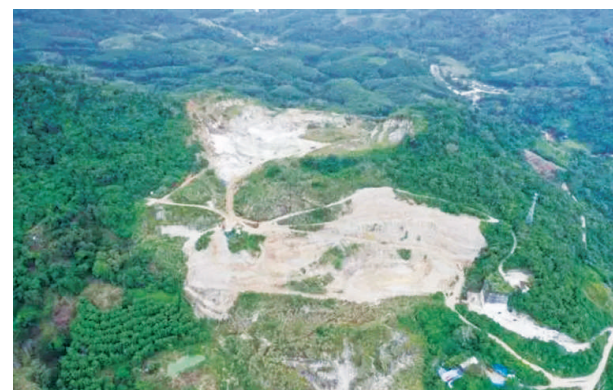
2023年11月30日，督察组现场督察使用无人机拍摄，琼中县什运宏兴石料场矿区生态修复仍未取得实质性进展。