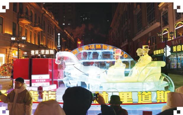
1月11日，游客在中央大街的冰雕前拍照。

随着冬季的到来，哈尔滨这座充满独特魅力的城市成为冰雪旅游热点。越来越多的游客在尽享冰雪乐趣的同时，被哈尔滨深厚的文化底蕴和城市风情所吸引，追求更加丰富和个性化的旅游体验。