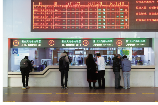
1月12日,春运火车票开始发售,旅客在上海火车站售票大厅购买火车票。