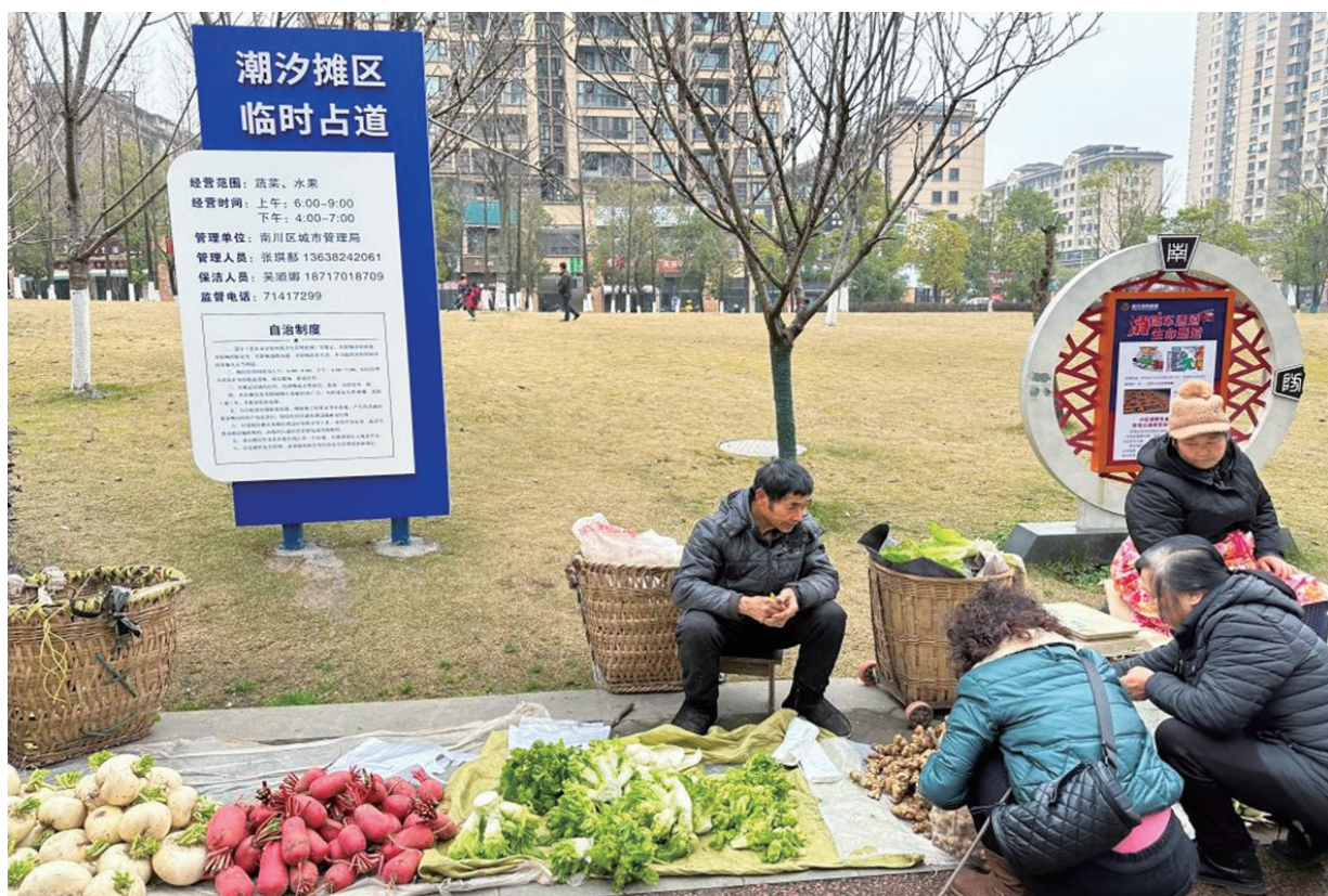
重庆南川区金科世锦城小区旁的“潮汐摊区”。

重庆将城市文旅项目引入社区,例如北碚区朝阳街道打造作图图书馆、社区艺术馆等,集便民服务、生活美学展示功能于一体。全国范围看,商务部去年11月启动“全国一刻钟便民生活圈”,部署各地开展各种便民服务项目,品质商品、绿色智能家电等进社区受到青睐;腾讯升级全国首张“一刻钟便民生活圈地图”,囊括300多个城市和40多