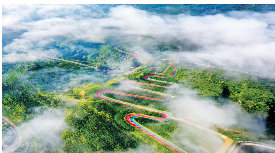
西山旅游公路宛如一条彩虹。

西山示范区聚焦改革创新，深化“三化三制”改革，做大做强平台公司。成立了文化旅游发展、文旅经济建设投资、文旅工程建设管理3家二级子公司。新成立第二家经营性投资公司——太原西山产业发展有限公司。2023