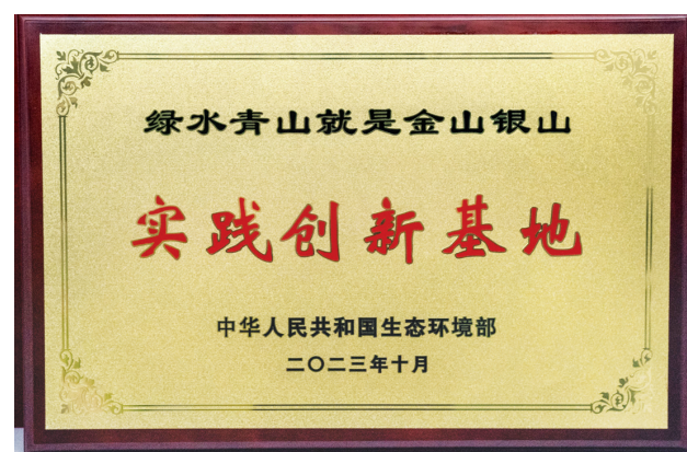
西山示范区成功创建全国第七批“绿水青山就是金山银山”实践创新基地。

此外，西山示范区还将聚焦特色主导产业的培育与发展，打造“一区多园”的共赢发展模式。北部依托汾河雁丘文化园、麦乐登亲子乐园、“西山归源”产城综合示范项目，创建岢岚山旅游度假区；南部以晋阳文化文物遗产、古城古镇古村落、森林湖泊等度假资源，引进六善酒店、洲际酒店、裸心度假村等高质量度假住宿设施酒店入驻，创建晋阳文化旅游度假区，力争年内创建成功。