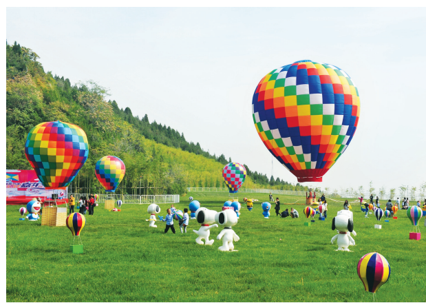
西山文旅业态丰富。

一年来，西山示范区狠抓文旅主业，产业发展焕发新活力。西山示范区大力发展生态修复、文化旅游、健康养生、体育休闲、科技研发五大幸福产业，推进实施了18个重点项目，其中生态类3个、产业类10个、基础设施类5个，总投资187.53亿元。西山示范区还成功入选山西省