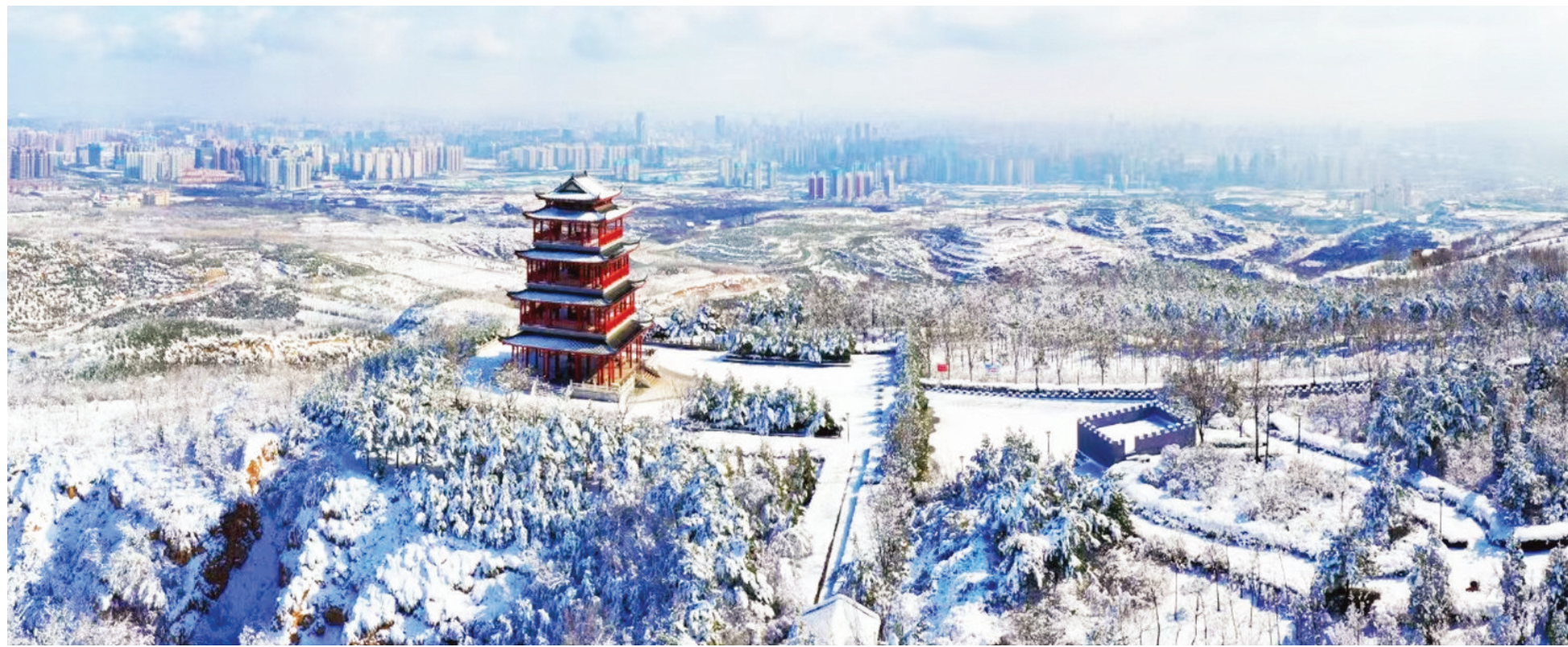
冬日的西山银装素裹。