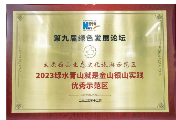
西山示范区被授予“2023绿水青山就是金山银山实践优秀示范区”称号。