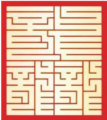
九叠篆「龘」（资料图片）