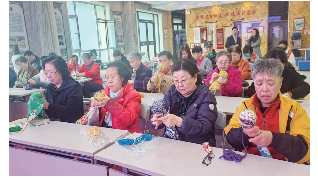
传承弘扬中华优秀传统文化