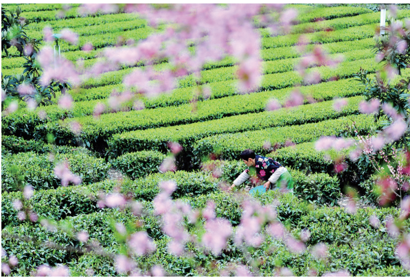
3月28日,湖北省宜昌市夷陵区太平溪镇茶农在生茶茶园里采制明前春茶。

南海之滨,“博鳌时间”再度开启。来自60多个国家和地区的近2000名嘉宾共聚一堂,围绕亚洲与世界如何共迎挑战、共担责任展开讨论,奏响一曲开放合作的大合唱,为推动全球共同繁荣注入信心和力量。