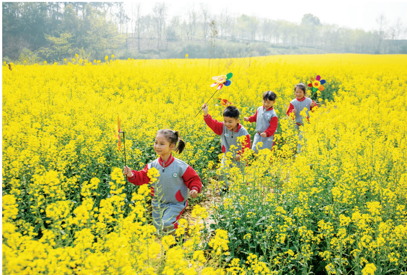
4月1日，浙江省湖州市长兴县泗安镇长岗岭村，小朋友在花田中奔跑。春光明媚，百花绽放，人们纷纷来到户外，感受春暖花开的美好。

在提升办案质效方面，最高检要求，要深入推动检察赋能法律监督，加强线索发现核查以及风险排查，对黑恶组织惯常实施的犯罪的警情、线索、案件，重点审查、串并分析、建模深挖，及时发现掌握“乱生恶”的动向和“恶变黑”的线索、信号，监督督促公安机关及时查处、查深查透。并且，要持续完善省级人民检察院统一把关机制，持续开展落实情况督导检查，压实把关责任。