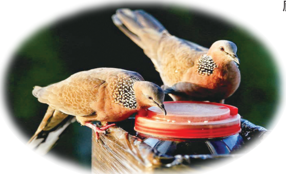
阳台上正在啄食的斑鸠

提,因为与晋阳城的建设者赵鞅(赵简子)相关。《列子·说符》载:“邯郸之民,以正月之旦,献鸠于简子,简子大悦,厚赏之。客问其故?简子曰,正旦放生,示有恩也。客曰,民知君之欲放之,故竟而捕之,死者众矣。君若欲生之,不若禁民勿捕。捕而放之,恩过不相补矣!简子曰,然。”意思是,邯郸的老百姓,在正月的一天,捕捉斑鸠献给赵简子。简子十分高兴,厚赏献鸠百姓。客问,为什么这样?简子说,我可以用来放生,以表示恩泽。客说,老百姓知道你有放生的喜好,这才竞相捕鸠,造成的后果是鸠鸟死去比活着的多。你真要放生,倒不如禁捕。捕而再放,恩遇和过失不能相抵。简子听了,从善如流,说,是这个道理。邯郸盛产成语,有谓“成语故乡”,这一成语虽用之无多,但理趣颇富,喻义做事情要讲求实效,不可图虚名。应该说,这一思想成果是来自斑鸠的贡献。