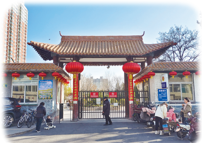
义井公园北门

这就是义井公园啊,与家的距离如此贴近。再次环顾这座与化工相伴的公园,朴素的外表,火热的内心,如同一代代建设化工的人一样。