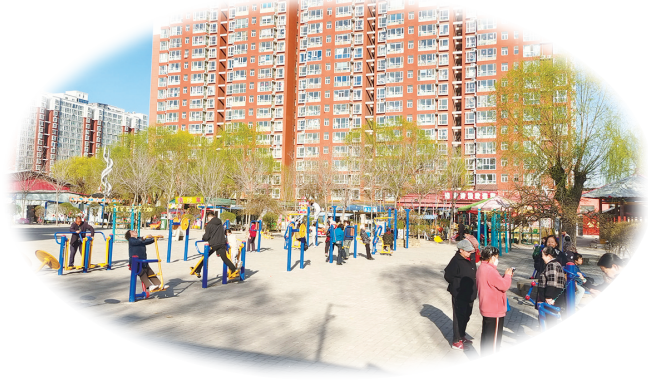
在义井公园锻炼的人们

黄河开河未行洪,河水全部拦蓄利用,这是古老黄河的又一个新变化,是人类的一大进步。