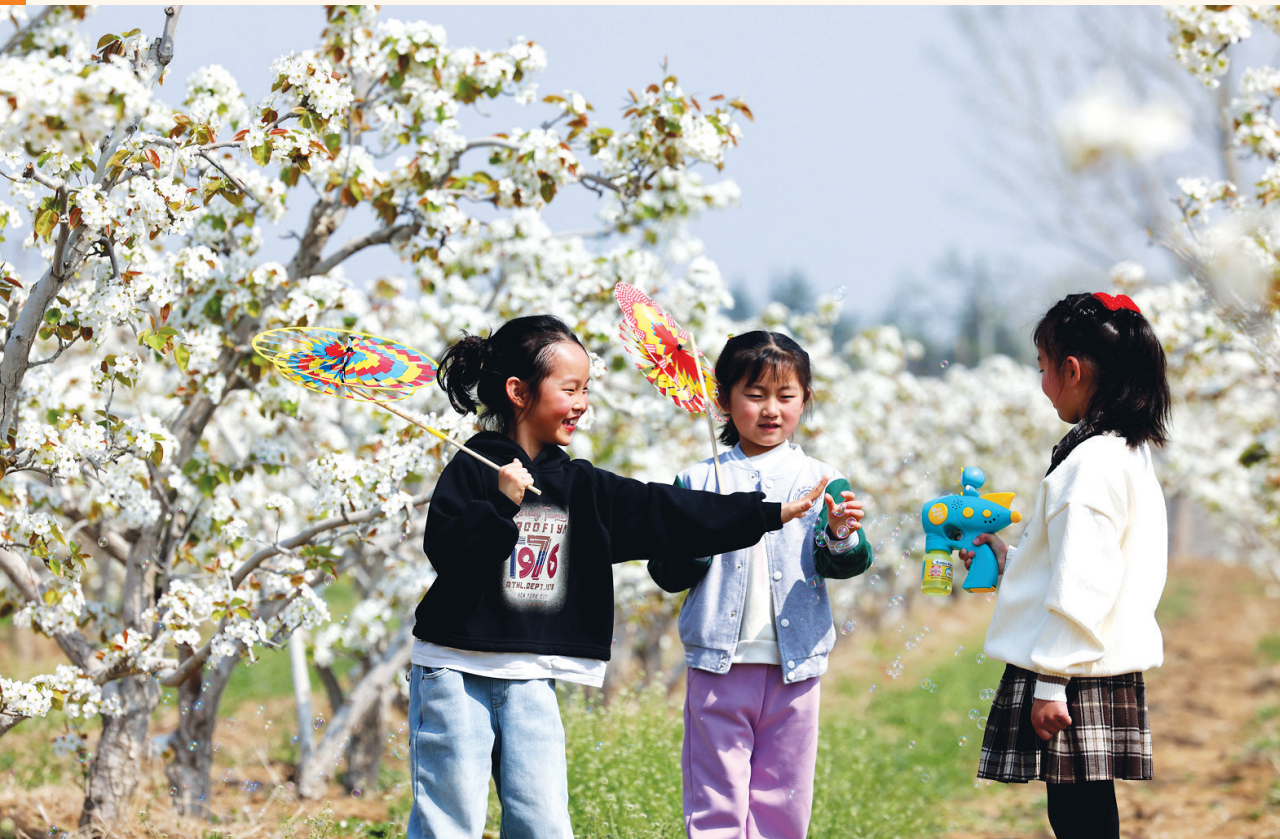
4月6日，小朋友在山东省枣庄市西王庄镇秧歌园玩耍。

清明，是节气，也是节日。不论“雨足郊原草木柔”，还是“遥听弦管暗看花”，这个清明小长假，大城小镇涌动的人潮、把文化“穿”上身的国潮、吃住行游乐购的热潮，既加速释放了消费市场的潜力，也为推动经济回升向好注入动力。