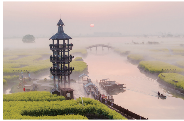
4月9日拍摄的江苏省兴化市千垛菜花景区雾景(无人机照片)。当日,江苏省兴化市出现大雾天气,兴化市千垛菜花景区轻雾缭绕,景观在雾中若隐若现,宛如一幅水墨画。