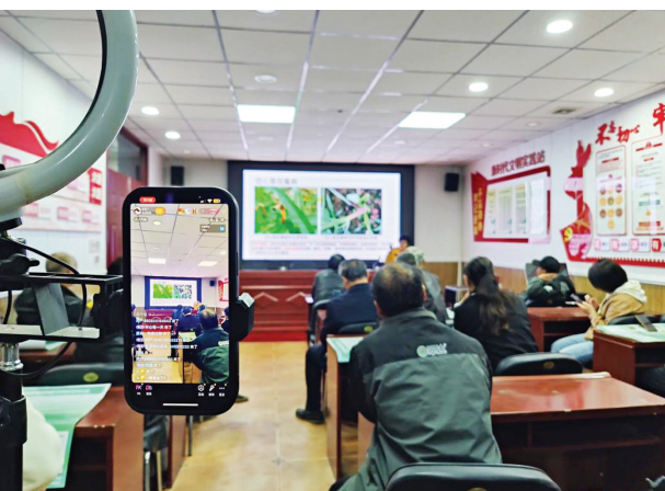
成子村“农民夜校”讲座现场。

近年来,柳杜乡共组建“农民夜校”11个,按照“村民想听什么就讲什么、村民在哪里课程就开展到哪里、村民什么时候有空就什么时候讲”的原则,努力将“农民夜校”打造成为村民的理论课堂和技能加油站。截至目前,11个“农民夜校”已开展各类课程231期,惠及村民上万人。下一步,各“农民夜校”将邀请更多经验丰富的专家,创业致富带头人等为村民授课,全力打通基层群众教育培训的“最后一公里”,为乡村振兴注入新能量。