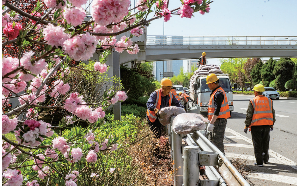
正值万物生长季节，4月15日，市道路绿化养护中心施工人员在滨河西路汾桥西附近绿化带增铺木屑等覆盖物，起到改善土壤肥力、美化景观和节能环保的效果。

要加强农技指导，扎实做好农技人员进村入户技术服务工作，以玉米、大豆等主要粮油作物为重点，聚焦2024年农业主推品种、主推技术，统筹推进良田、良种、良机、良制融合，指导落实关键技术，提高优良品种、适宜技术普及率、到位率。要做好农机准备，准确掌握农机数量、作业需求等情况，协调做好供需对接、用油保障等工作，确保农机数量足、状态好，保障春播适时有序开展。要扩大机械播种面积，规范机耕机播作业，提高播种效率和质量。(周皓)