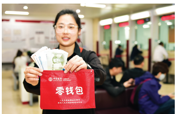
金虎商业员工展示中国银行“零钱包”

3月27日14时,一名老年客户着急地来到浦发银行运城盐湖支行,声称要开立福彩账户,向香港福彩部汇款3万元。工作人员立即意识到客户可能遭遇电信诈骗,经运营主管与客户深度沟通,获知该客户是一名股民,已持续炒股多年。他自2023年10月起加入了多个微信群,现有一名“区块链彩票群”里的人员声称,可通过香港福彩区块链进行选号比赛投票,入群前需向某微信公众号捐款68元,进群后会进行多轮免费投票选号推荐,有机会开立福彩内部户获取收益。