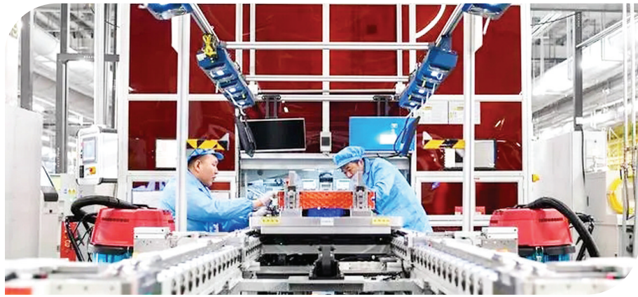
2月2日,工作人员在一汽弗迪新能源科技有限公司生产车间内作业。