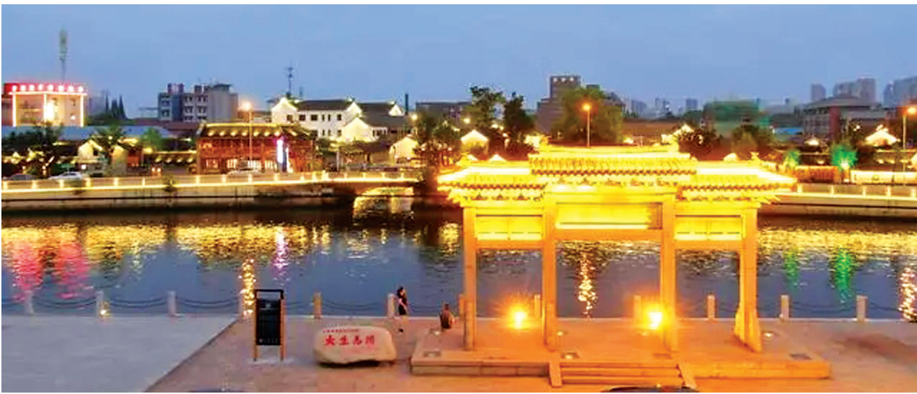
唐闸历史文化街区华灯初上。

江海之畔,连接京杭大运河与长江的通畅运河静静流淌,南通唐闸历史文化街区枕河而生。建于1915年的地标建筑钟楼,每到整点准时响起浑厚的钟声,穿越百年的悠远时空。