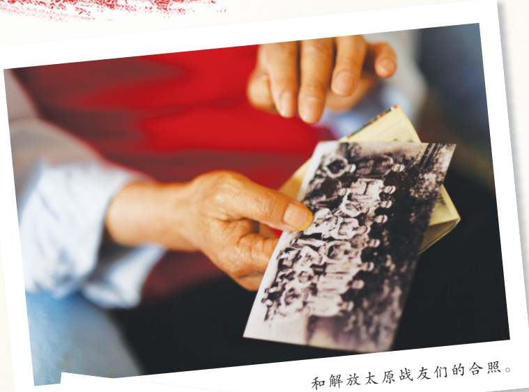
和解放太原战友们的合照。