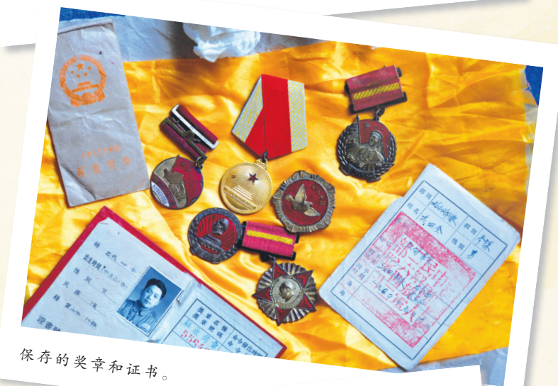
保存的奖章和证书。