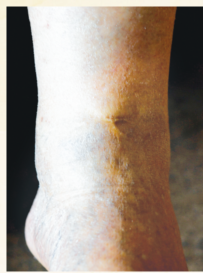
战场上留下的伤疤。