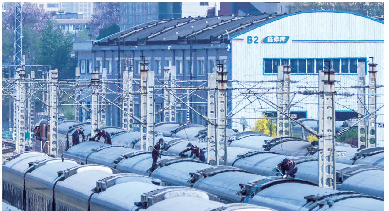
5月6日,中国铁路太原局集团有限公司太原车辆段对1661辆客车和92组动车的空调机组及滤网进行检修保养,为夏季旅客出行提供舒适的乘车环境。