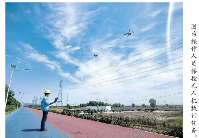
图为操作人员操控无人机执行任务。

国网山西超高压输电公司将进一步深化无人机集群化作业应用,充分融合无人机自主巡检微应用,并持续拓展无人机应用场景,打造高质量输电巡检品牌。