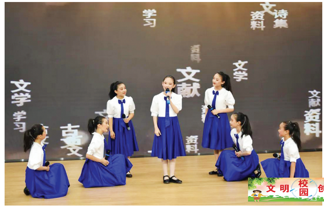
清徐县第六届中华经典诵读大赛现场。

本报讯 为传承发展中华优秀传统文化,落实全国青少年读书行动,近日,清徐县第六届中华经典诵读大赛在栲阳小学校举行。 此次比赛以“典籍中华 赓续文脉”为主题,经过选拔,共有19个小学组代表队、16个中学组代表队进入决赛,带领现场观众一同领略中华经典诗词的铿锵音韵。 舞台上,学生们借古励今、以诗言志,情到深处的独诵、热血沸腾的群诵,充分展现了经典文学作品的无穷魅力,也展示了新时代中小学生对美、欣赏美、展示美、歌颂美的情怀。一首首耳熟能详的经典诗词,一篇篇脍炙人口的经典美文,激发了在场师生对中华民族光辉历史和灿烂文化的认同。 下一步,清徐县将以中华经典诵读作为建设书香校园的一项重要举措,引领全县广大师生走进文化经典的殿堂,在诵读中感悟中华文化的精髓与魅力,营造浓郁的读书氛围。(孙佳敏)