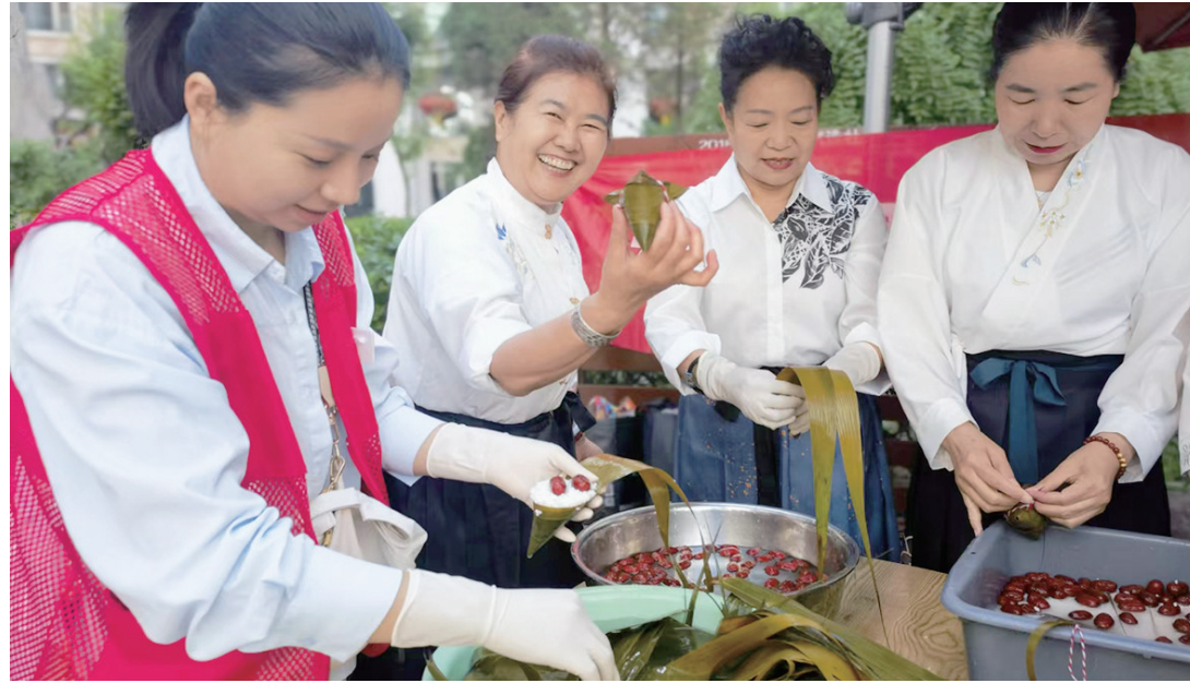
社区居民一起包粽子。

本报讯 6月1日，平阳路街道各社区开展形式多样的端午节主题活动，居民通过“沉浸式”体验端午民俗，切身感受中华优秀传统文化的深厚魅力。