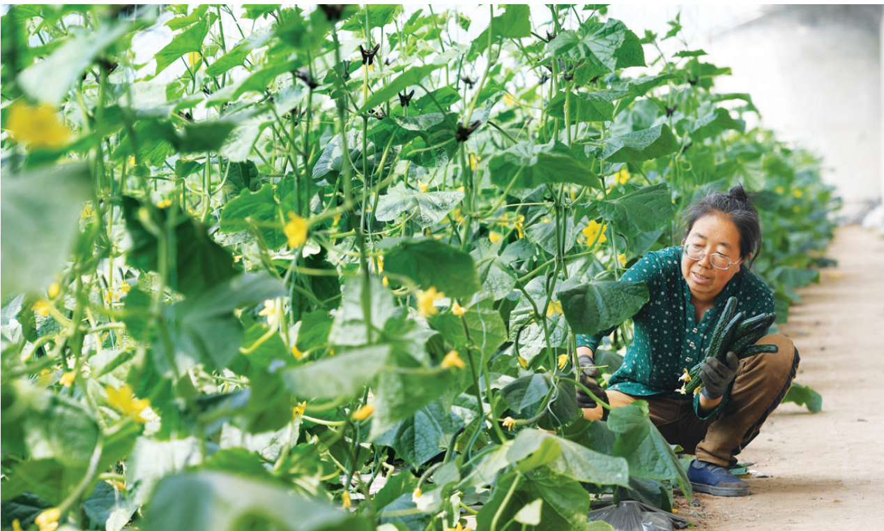
6月4日,阳曲县林针沟村新建成的大棚里,蔬菜长势喜人。作为阳曲县“千万工程”精品示范村,该村挖掘自身优势,发展大棚种植和观光农业,拓宽农民增收致富渠道。

通过现场路演、评委打分的形式,比赛最终决出结果。“数字化口腔一站式护理连锁品牌”和“禾迈研学,探索乡土中国的无限课堂”两个项目分获主体赛道和专项赛道的一等奖;“医学营养健康服务”等项目获二等奖;“光咖咖Light coffee”等项目获三等奖。随后,小店区推荐的优秀项目将进入太原市选拔赛,角逐更高的荣誉。(王丹)