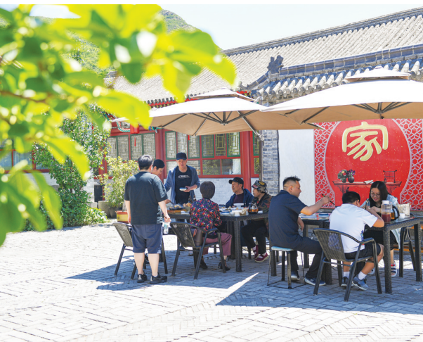
游客在石峡村的农家院餐厅用餐(6月1日摄)。

团队和先进设备为长城“精准诊疗”。“石峡关所在的八达岭区域目前拥有无人机文物巡检平台和智慧景区管理平台,未来还将实现区域内流程协同、数据分析等技术升级。”延庆区文物局副局长刘满利说。