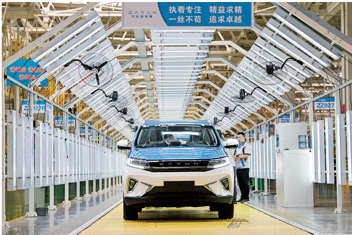
2024年6月13日，在位于山西省运城市经济技术开发区的大运新能源汽车生产基地，新能源汽车准备下线。近年来，中部各省抢抓机遇，重点布局新能源汽车产业，逐渐形成一批新能源汽车生产基地。新能源汽车产业也成为中部省份经济发展的新引擎。

聚AI企业的“中国声谷”。向西望，深空探测实验室总部落户合肥“未来大科学城”核心区，一条“逐梦星空”的新赛道正在打开。