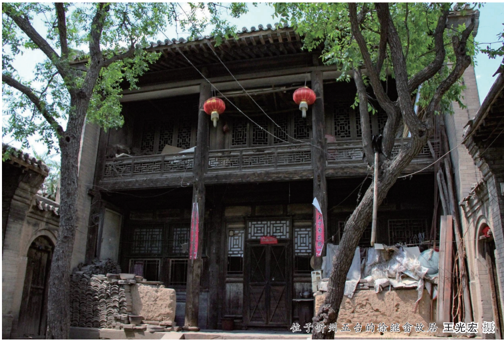
徐继畲故居(资料图片)

为英军攻陷，漳州民心惶惶，一日数惊，文武官员中，一些人将家眷偷送出城，百姓也多有逃亡之意。徐继畲竭力抚以镇静，誓以死守，调兵募勇，昼夜防守，人心方渐渐安定。在最紧张的时候，徐继畲“谓夫人曰：‘城如不保，陈忠惠公(隋朝的陈君泰)祠内，吾尽节处也，卿且奈何？’夫人笑曰：‘相从俱死耳，此事岂待商量！’”(《徐氏本支叙传·续夫人传》)英军驻厦门十余日，未攻漳州，即北上攻陷定海、镇海、宁波。徐继畲在写给友人的信中，曾谈及这段战争的经历：“一年以来，驰驱海岸，日不暇给，自厦门失守之后，则寝食不遑，心力交困，劳悴不堪言状。自念一介寒微，曾受知遇，当此危难之际，正当捐糜图报，逆夷叵测，事无了期。与此土为安危，与此地为存亡，以八字自坚，曰：竭力尽心，听天由命。如是而已。”表明了一位正直的知识分子在国家民族面临危难时舍生取义、以身殉国的决心。