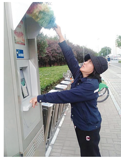
工作人员开展维护清洁工作。