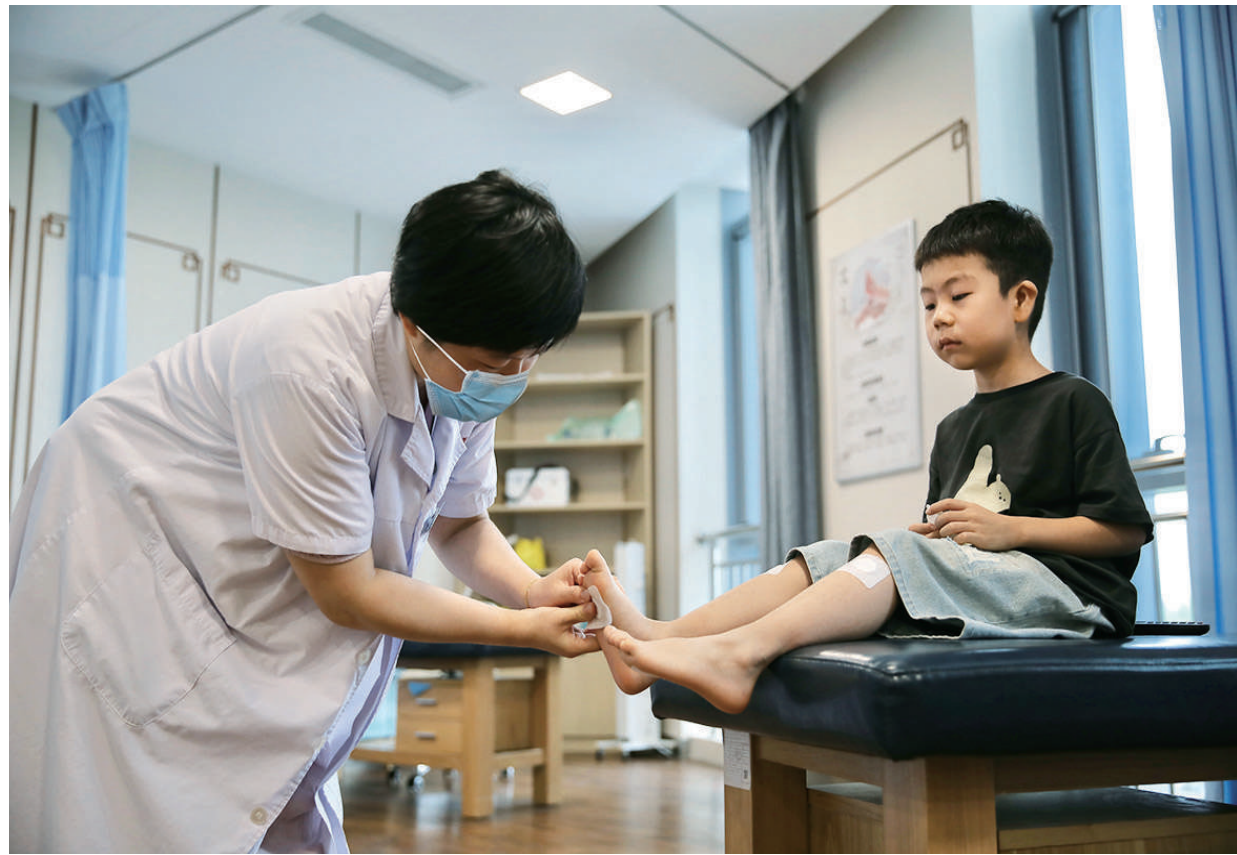
7月15日入伏,“三伏贴”成为不少市民冬病夏治,调理身体的选择。图为太原市妇幼保健院医生给小朋友贴“三伏贴”。