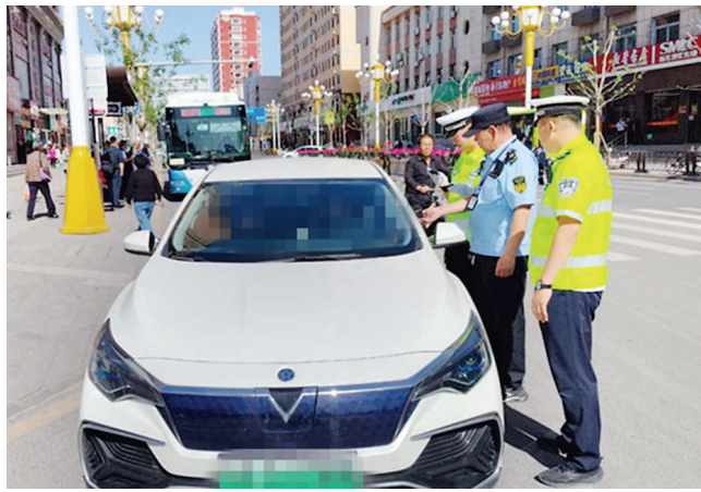
民警查处交通违法行为。

本报讯 阳曲县公安局7月15日发布消息,为有效预防和减少道路交通事故,该局交警大队推出4项措施,开展暑期交通安全整治行动。