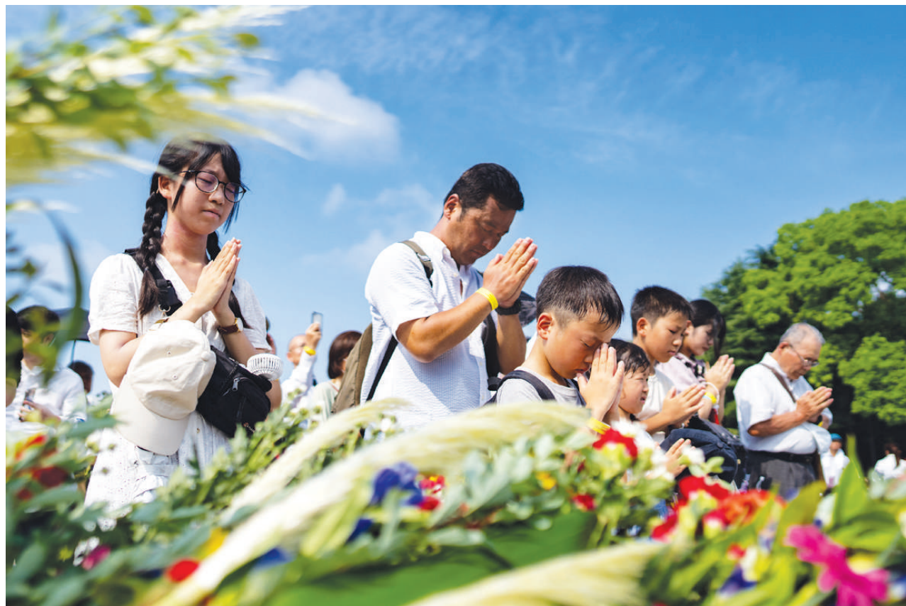
8月6日，在日本广岛举行的遭原子弹轰炸79周年纪念仪式后，人们排队献花，纪念原子弹轰炸受害者。日本广岛市6日在和平纪念公园举行遭原子弹轰炸79周年纪念仪式。日本各地民众在公园举行集会，抗议日本政府加速军备扩充的做法，呼吁日本政府以实际行动维护地区和平。

“抵抗之弧”是伊朗主导的一个抗以联盟，包括巴勒斯坦伊斯兰抵抗运动（哈马斯）、黎巴嫩真主党、胡塞武装以及一些伊拉克民兵武装。伊朗最高国家安全委员会秘书阿里·阿克巴尔·艾哈迈迪安表示，“抵抗之弧”所有成员都会就哈尼亚遇刺实施报复。（据新华社电）