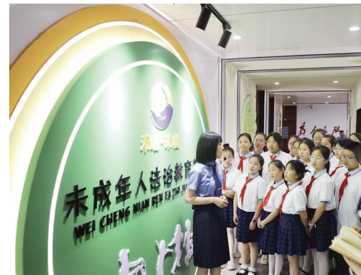
学生参观法治教育基地