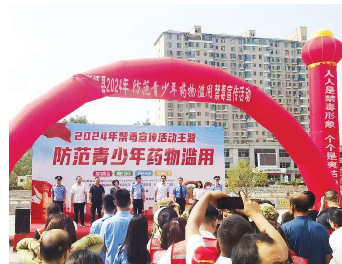
检察机关开展防范青少年药物滥用宣传活动