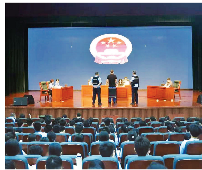
小店区检察院在省实验中学开展庭审进校园活动