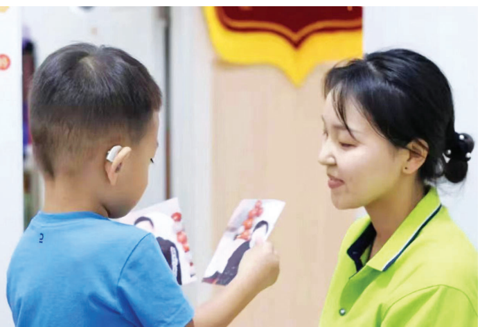
特教老师对残疾儿童进行训练