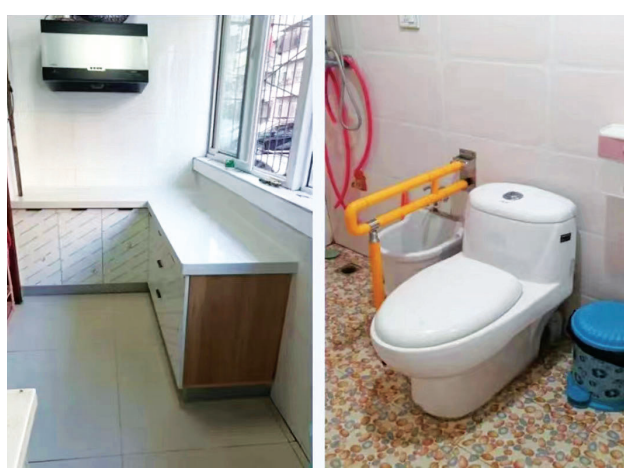
为残疾人家庭做无障碍改造