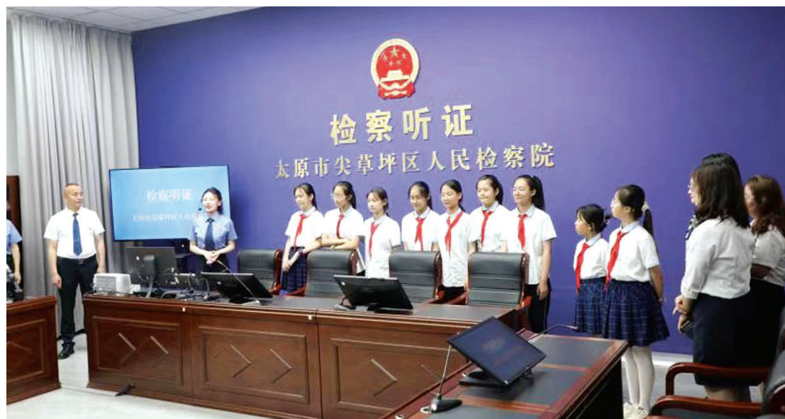
尖草坪区第六实验小学学生参加检察开放日活动

面对未成年人犯罪形势，我市检察机关持续增强预防未成年人犯罪工作的责任感和主动性，以检察能动履职教育、感化、挽救涉罪少年，防范未成年人误入歧途。一方面，坚持全程、精准帮教，联合教育、民政、工商联、社区等多方力量，设立22个企业型或社区型观护帮教基地。3年来，共对274名涉罪未成年人精准帮教8347次，其中20人经帮教考上了大学。另一方面，深化法治宣传教育，全市276名检察官担任中小学校法治副校长，严格落实普法责任制要求，并建成了4个青少年法治教育基地，迎接10万名学生参观。