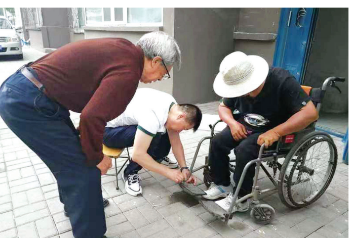
对轮椅进行日常维护