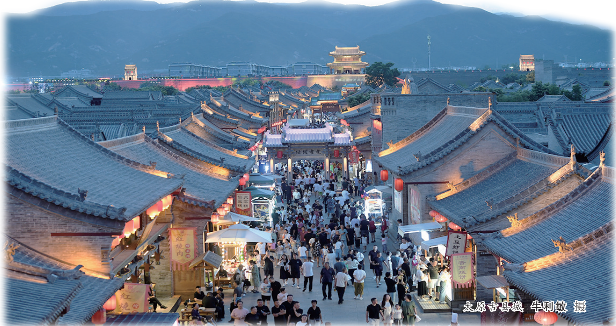
太原古城城

每一座城市都有她的标志物,双塔被作为太原象征已有四百载,其所在的寺院叫永祚寺。双塔一名“文峰塔”,一名“舍利塔”(或宣文塔),因其高度为太原文物建筑之最,合称“凌霄双塔”,又称“文笔双峰”。永祚寺双塔建于明万历年中叶,被誉为“晋阳奇观”。永祚寺的明代牡丹美其名曰“紫霞仙”,艳压洛阳、菏泽牡丹,美若仙境桃源。双塔之南,是静幽肃穆的革命烈士陵园,每年清明前后,双塔牡丹苞苞带露时节,来陵园为解放太原时牺牲的革命先烈和英雄扫墓的人流络绎不绝。“文笔”向天,同时书写着太原红色革命斗争历史;双塔凌霄,始终高扬山西革命先驱不朽精神。