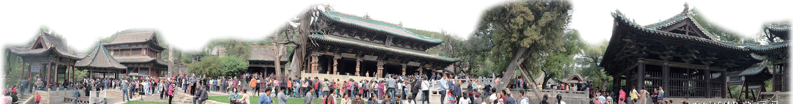
人流如织的晋祠

太原城东西两山相映,汾河水由北向南穿城而过,城西倚靠着三座奇秀的山峰,由南及北分别是天龙山、龙山、二龙山。天龙山石窟“微笑的佛首”,因2021年春节联欢晚会特意播出了海外世纪回归而成为网红。梁思成先生曾专为天龙山石窟艺术撰文《佛像的历史》,考证第一、二、三窟为北齐造像,其余22窟“皆隋唐物”。龙山石窟是元代开凿的道教石窟,共9窟65尊造像,与天龙山石窟佛像盗毁比较严重的遭遇不同,龙山石窟是国内现存规模最大、题材最丰富、保存最完好的纯道教石窟。晋祠所在的悬瓮山,是晋水的源头,也是晋国国号的出处——周成王“桐叶封弟”,将弟弟虞封于唐地,后其子燹父改国号为唐为晋——晋祠是为了纪念叔虞及其母邑姜而建,所以也称“唐叔虞祠”。晋祠有三绝:周柏、宋代彩塑、难老泉,而年轻人更喜欢的是,圣母殿前木雕盘龙柱上那条我国唯一留存下来的会用龙爪比划剪刀手的“比耶龙”。晋祠之北是太山,山上的龙泉寺据传当年秦王李世民曾在山下泉水中洗马,故而得名。北边的二龙山是龙头,山下有窦大夫祠,傅山先生出生于此处的西村,晋祠“难老泉”牌匾即为傅山书法。