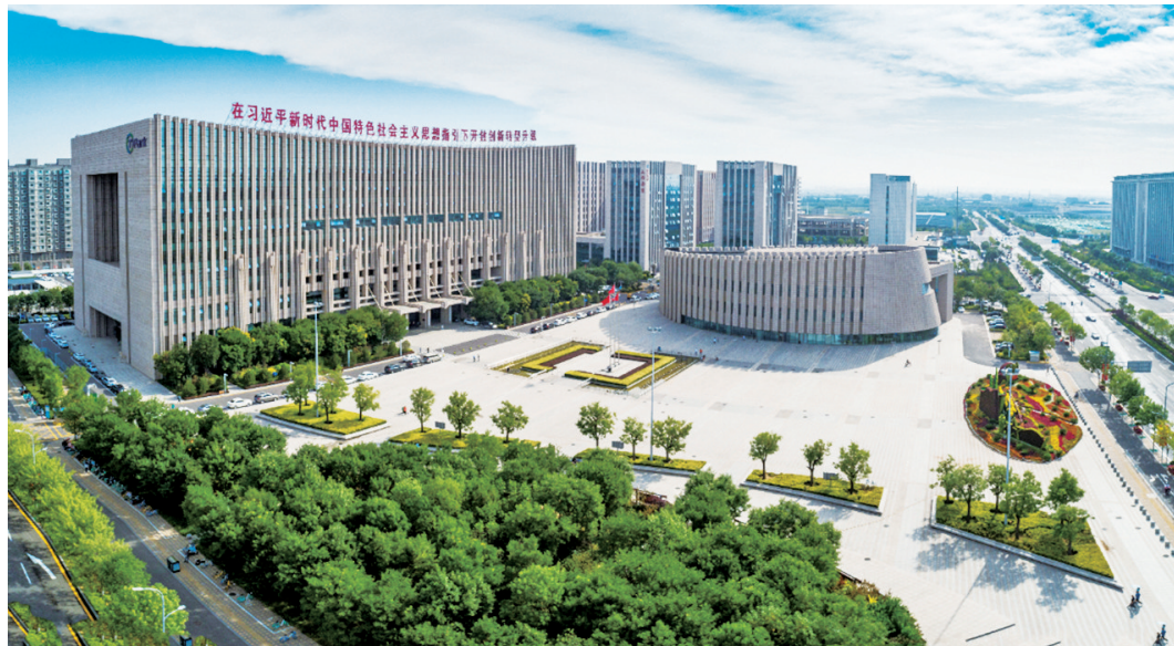
山西综改示范区

企业的发展在于创新,而创新的核心就是人才。今年,综改示范区设立“留学人员创新创业专项资金”,每年度安排不低于2000万元人民币用于鼓励和扶持留学人员创新创业。经审核通过的留学人员创新创业启动支持计划项目,将给予20万元至100万元创业启动资助。