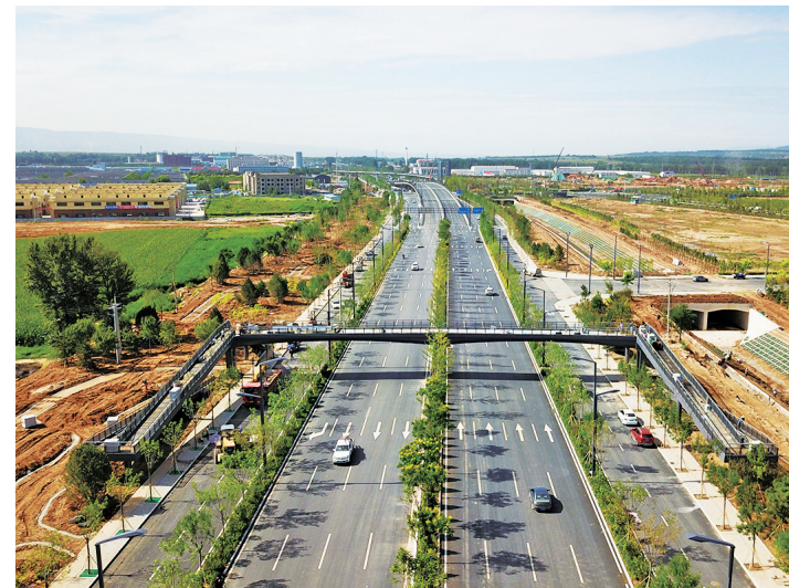
太忻一体化经济区大孟新城