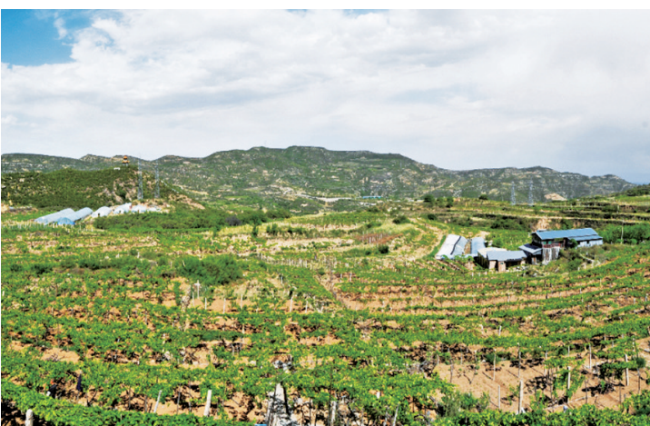
清徐葡萄峰山庄