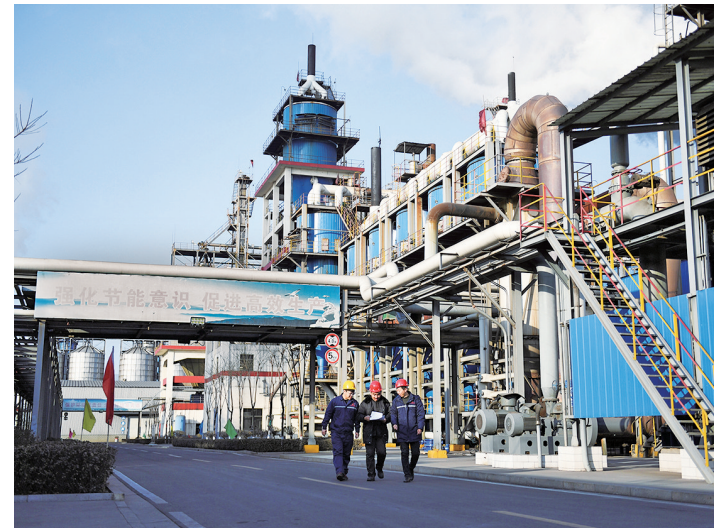
清徐经济开发区

聚焦七大产业集群,太忻一体化经济区延伸出特殊钢、铝镁合金、合成生物、碳基新材料、轨道交通装备、工程起重机、煤机装备、法兰锻造8条具有发展基础的优势特色产业,以及大数据、半导体、锂离子电池、太阳能电池、可降解塑料、节能环保6条具有成长潜力的新兴产业链,构建“链主”企业牵引带动、“专精特新”企业集聚配套,产业园区和创新平台有效支撑的产业生态。