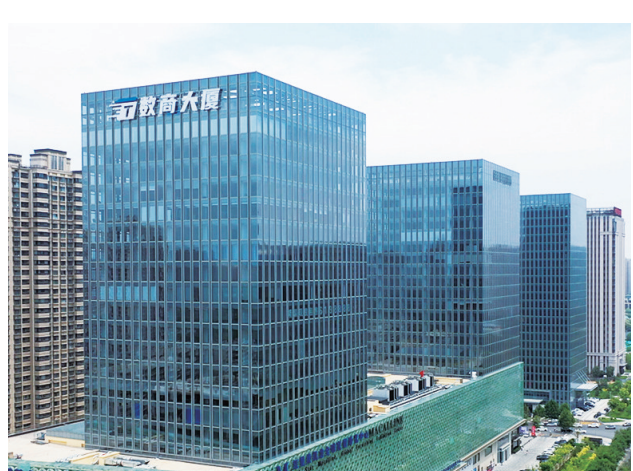
数商大厦