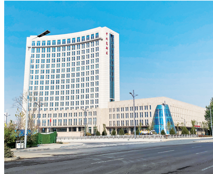
中北经济开发区