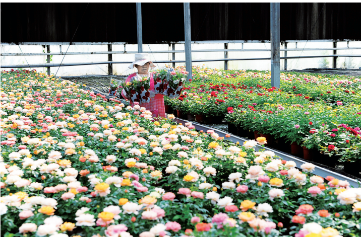
振华园艺花卉产业园