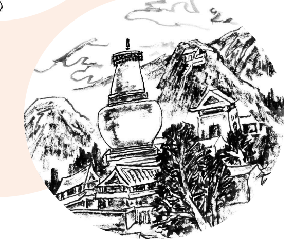
徐继畲告老还乡执教起山书院期间，编修《五台新志》，频繁地记载了晋北农村农民的艰辛劳动和贫困生活，还通过历史事件的叙述，在一定程度上揭露了官吏的贪婪、腐败和昏庸无能。

1840年7月，英军进犯厦门，徐继畲刚调任汀漳龙道，驻漳州，距厦门仅70里。他迅即调集民兵修筑工事，用大木排堵筑镇门各港口，准备抗击英军。