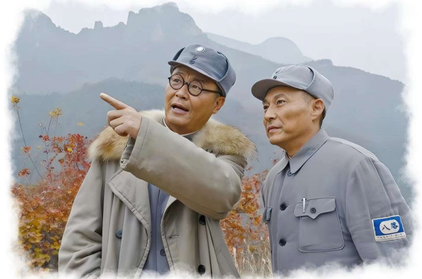
电视剧《太行山上》剧照