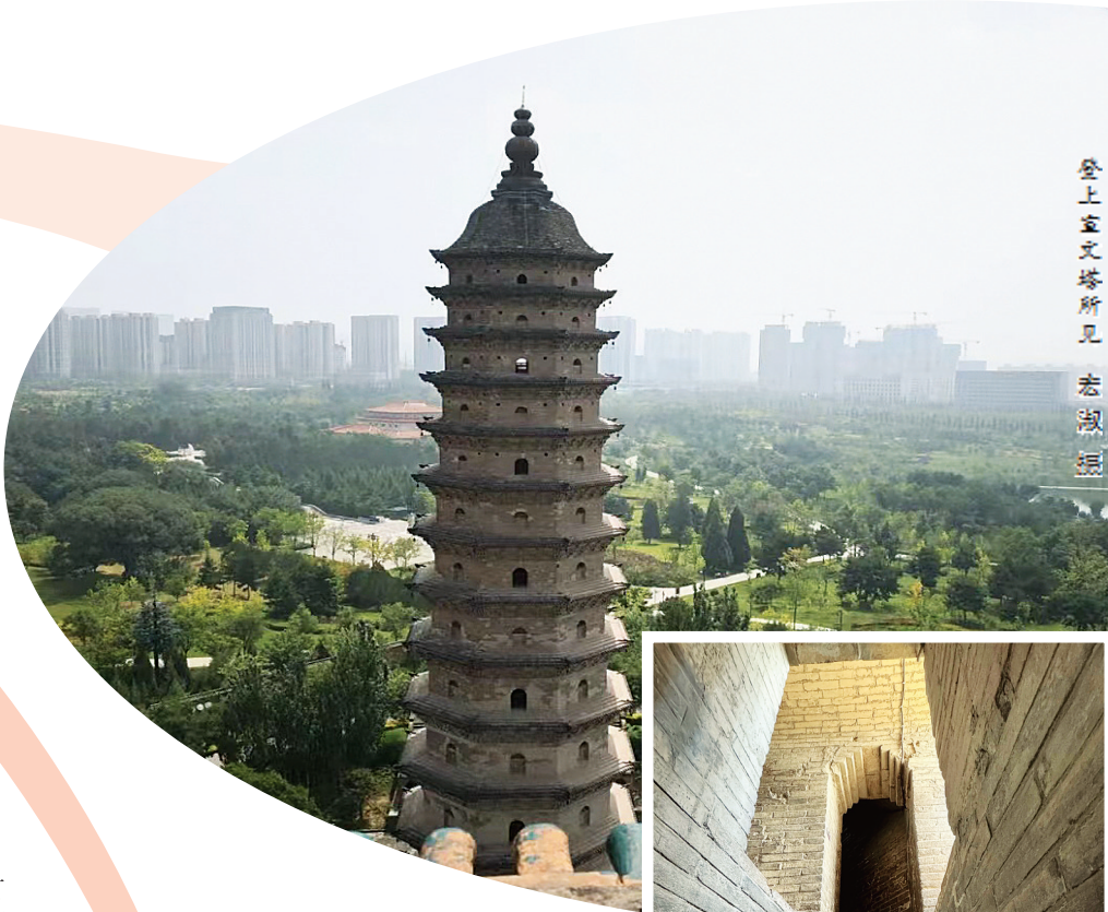
登上宣文塔所见

每当我品尝烧土豆的时候，就会情不自禁地联想到曾经领略过的家乡秋天的美景。农舍、果园、山梁、沟岔、小河流水，都吐露着芬芳，散发着美味。近年来，为了保护生态，为了消防安全，山上已不允许点明火、烧土豆，就像这口的我，左思右想，前些日子，把刚挖出的土豆拿到了自家院子烧，味道不及曾经，但我已心满意足。秋已深，阵阵秋风带来了丰收和不变的美味。