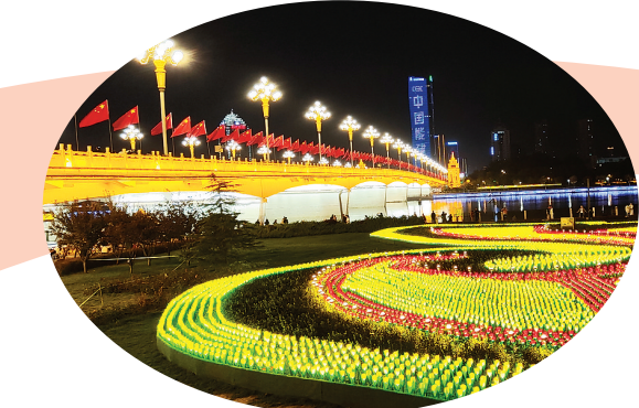
国庆期间的迎泽大桥与汾河景区