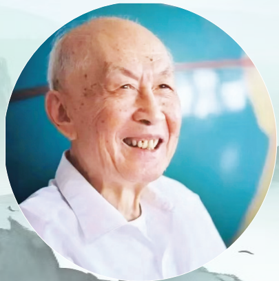
朱光亚先生(资料图)