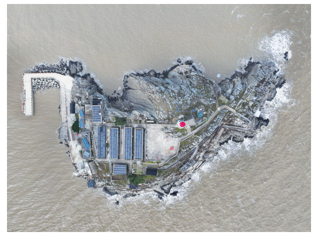
这是10月25日拍摄的开山岛(10月25日)。

天在岛上做着同样的事情,日复一日,把平凡事做到极致。如今,一批又一批年轻人坚守海岛前哨,传承爱国奉献的守岛精神。