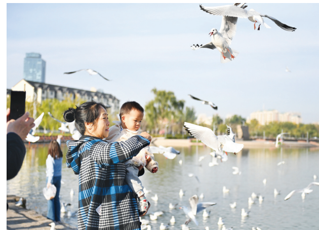
10月28日,市民在银川市海公园观赏红嘴鸥。

习近平最后强调,建设文化强国是全党全社会的共同任务。要加强党中央对宣传思想文化工作的集中统一领导,完善文化建设和管理体制机制。各级党委和政府要切实加强对组织领导,做好干部配备、人才培养、资源投入等工作,调动各方面积极性主动性创造性,汇聚起文化强国建设的强大合力。