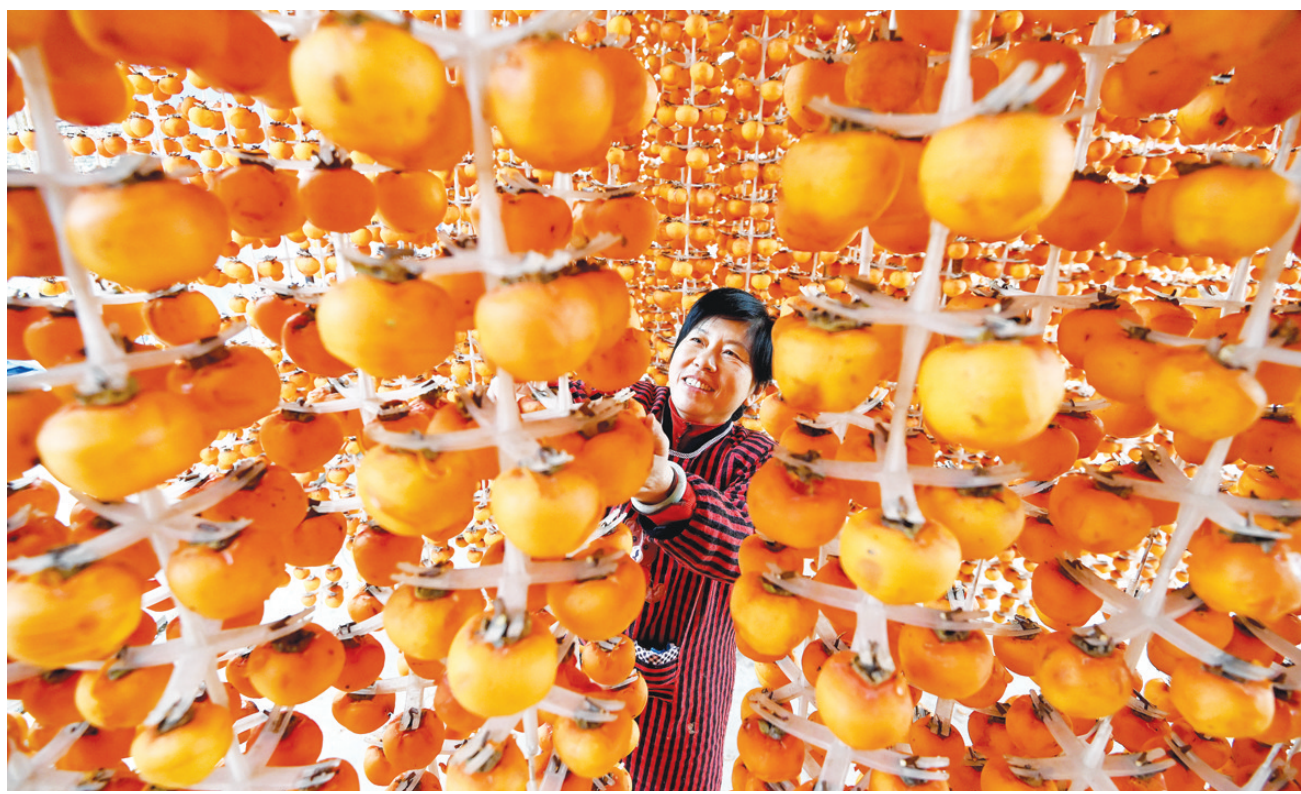
10月28日,河北省邯郸市磁县北贾壁乡北贾壁村的农民在晾晒柿子。金秋时节,多地农民利用晴好天气开展秋收、秋种等工作,确保丰产丰收。