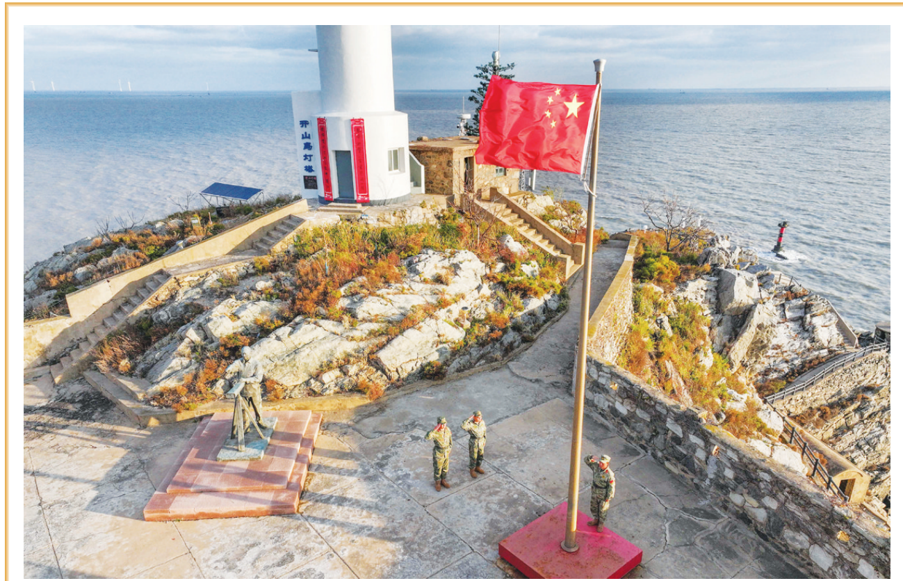
开山岛守岛民兵迎着朝阳举行升旗仪式(10月26日摄,无人机照片)。

《若干措施》要求,各地区、各有关部门要切实提高政治站位,增强做好新时代人口工作的责任感和使命感,细化优化具体措施,落实政府、用人单位、个人等多方责任,确保生育支持各项政策措施和任务落到实处、取得实效。