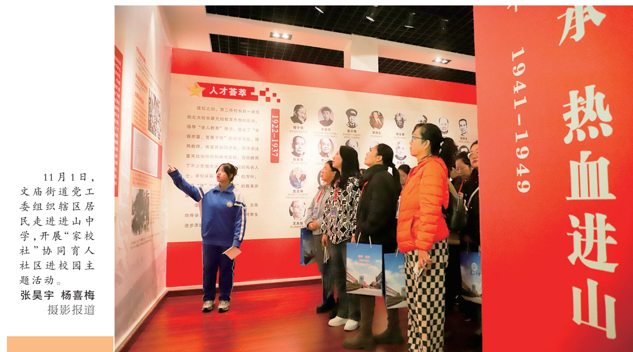
11月1日,文庙街道党工委组织辖区居民走进进山中学,开展“家校社”协同育人社区进校园主题活动。

11月2日,2024第四届环太原公路自行车赛将迎来第三个比赛日(东山赛段),也将是最终的冠军决赛日。东山赛段全程110公里,起点设在迎泽大街太原站西侧,途经迎泽大街、解放路、府西街、滨河东路、东山旅游公路等路段,最终抵达双塔公园南门。这段赛程不仅是速度与耐力的比拼,更是古都文化与时尚骑行的交融互动。(杨尔欣)