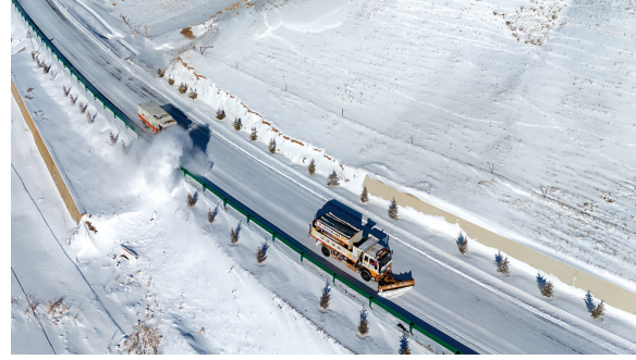
11月25日，工作人员驾驶除雪设备，在甘肃南裕回族自治县境内的国道上开展除雪防滑保物作业（无人机照片）。