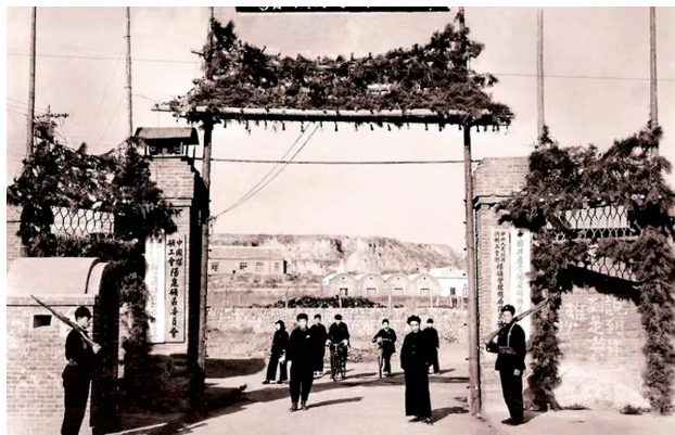
始建初期的阳泉矿务局

70年过去了,马家坪变电站仍保留着上世纪50年代以来的直流发电机、电动机、信号屏、故障录波器、各历史阶段继电保护、运动装置等设备近300台,这些设备已成为珍稀的电力工业文化遗产,对研究电力设备演变历史具有重要意义,更浓缩着供电企业的文化价值追求和开拓奋斗精神。