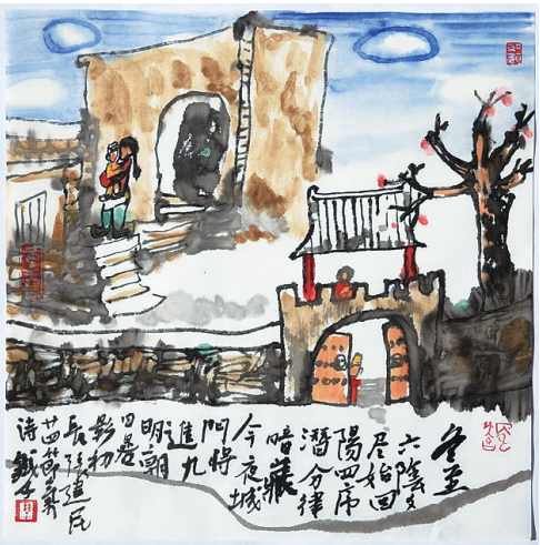
冬至 铁子 绘