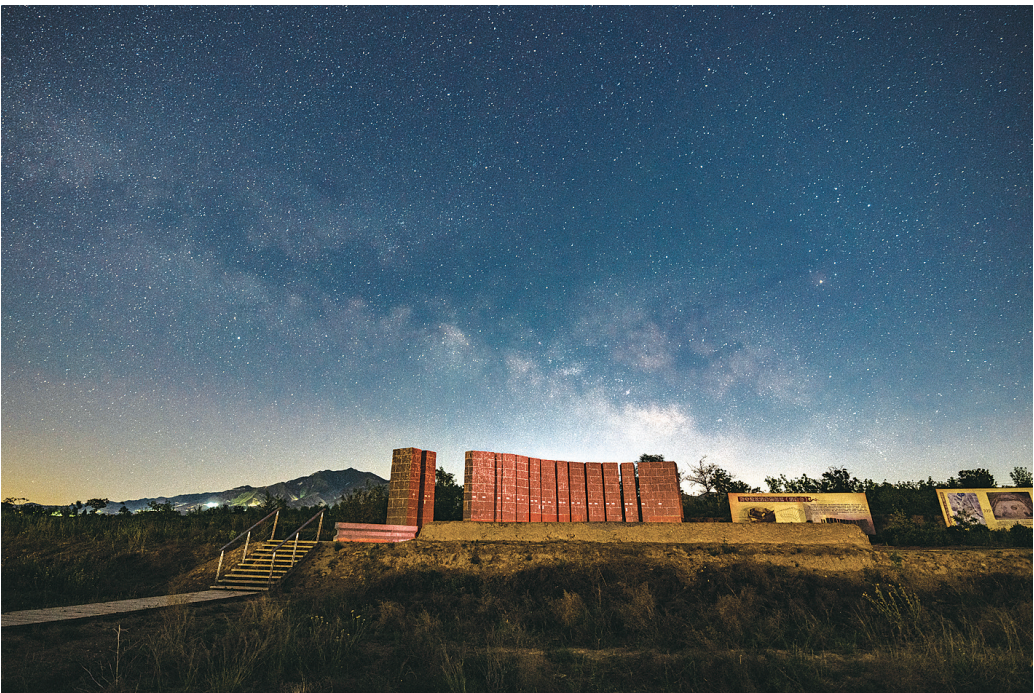
星空下的陶寺

中气十足，不是形容词。它实有所指。现在年轻人都开始养生了，推崇过“慢生活”。生活怎么慢下来？跟着节气走。春生夏长，秋收冬藏。春天这个节令我们播种，然后等到秋收的时候来收获。播种下去以后耐心地等待，不去做拔苗助长的傻事，或者幻想一