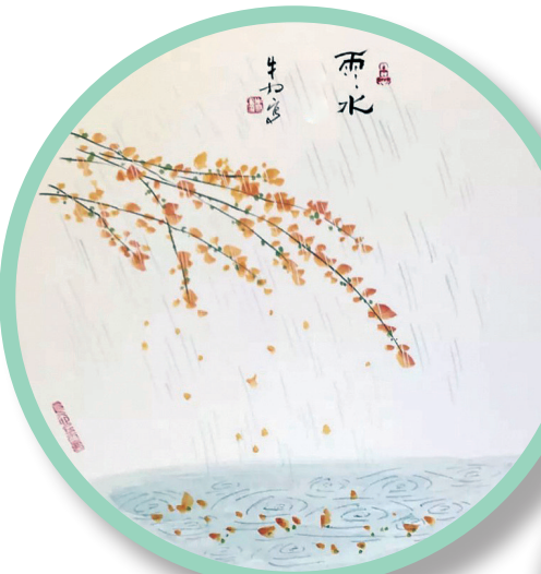
▲雨水 牛力 绘

着，长成我们自己的样子，我们以这样的面目辨认同胞，在古道西风瘦马的天涯用我们的语言和逻辑开释自己，思念家乡。