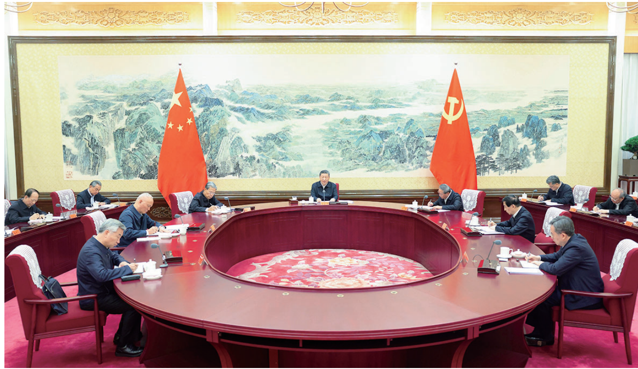
十二月二十六日至二十七日,中共中央政治局召开民主生活会,中共中央总书记习近平主持会议并发表重要讲话。

新华社北京12月27日电 中共中央政治局于12月26日至27日召开民主生活会,深入学习贯彻习近平新时代中国特色社会主义思想,围绕巩固深化党纪学习教育成果、综合发挥党的纪律教育约束和保障激励作用,把学习贯彻纪律处分条例、落实中央八项规定执行情况作为检查的重要内容,结合思想和工作实际进行自我检视、党性分析,开展批评和自我批评。 中共中央总书记习近平主持会议并发表重要讲话。 会前,有关方面做了认真准备。中央政治局同志同有关负责同志谈心谈话,听取意见建议,撰写发言提纲。会上,先听取关于2024年中央政治局贯彻执行中央八项规定情况的报告和关于2024年整治形式主义为基层减负工作情况的报告。中央政治局的同志逐个发言,围绕会议主题,对照《中国共产党纪律处分条例》、《中共中央政治