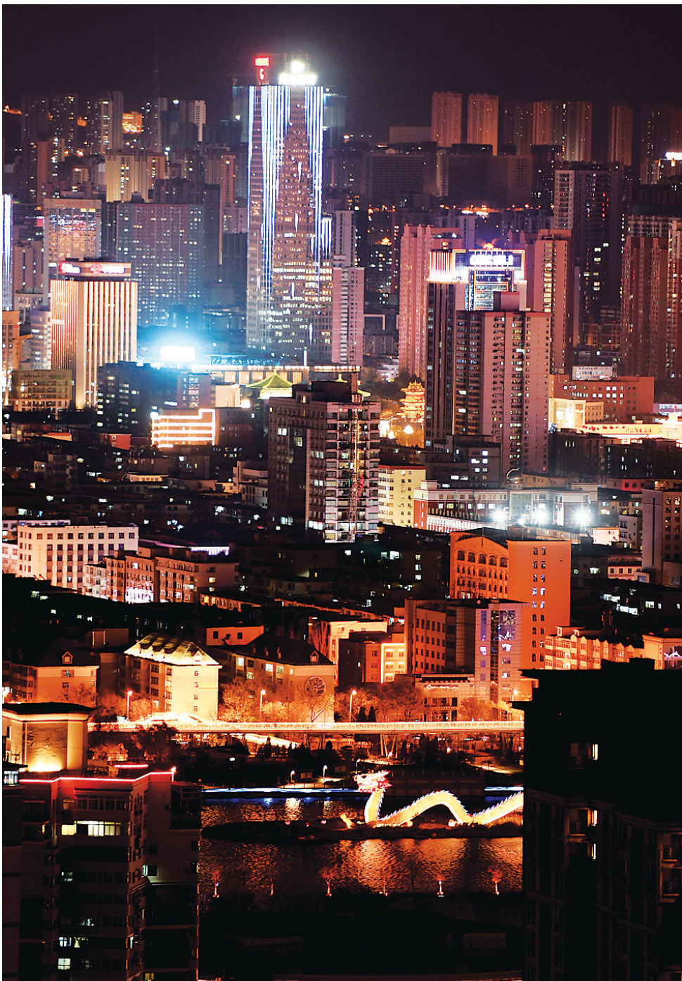
一月十五日晚，夜幕降临，璀璨的灯光与静谧的夜空构成了太原美丽的风景。

此次慰问活动进一步弘扬了拥军优属优良传统，营造出关心国防、尊崇现役军人、关爱军属的浓厚氛围。山西省退役军人事务厅、山西省军区政治工作局、山西省爱国拥军促进会、太原市退役军人事务局、太原警备区政治处、我市城六区退役军人事务局、山西省爱国拥军促进会会员单位、边海防军属代表、爱国拥军模范代表等共200余人参加。（弓凤飞）