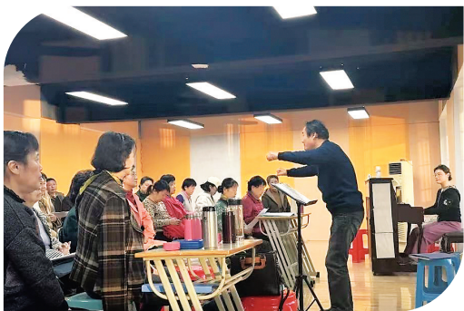
社区组织群众合唱。