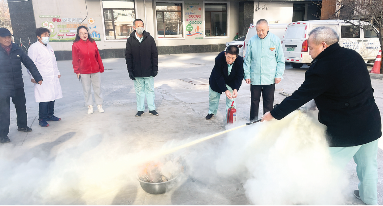
1月20日,双塔寺街二社区联合辖区养老护理院开展节前消防演练,强化驻地单位消防安全意识。